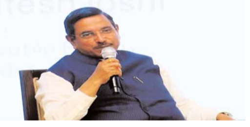
కూడా పెరిగాయి. కాబట్టి సామాన్యుల గురించి మాకూ ఆందోళన ఉంది. కానీ అదే సమయంలో గ్యాస్ ధరల పెంపు అనివార్యంగా మారింది. “

ప్రపంచ సంక్షోభం కారణంగా ఎల్పీజీ ధరల పెంపు అనివార్యంగా మారిందని కేంద్ర మంత్రి ప్రహ్లాద్ జోషి తెలిపారు. గ్యాస్ సిలిండర్ ధరల పెంపు పట్ల కేంద్రం కూడా బాధపడుతోందని, అలాగే విచారం వ్యక్తం చేస్తోందని పేర్కొన్నారు. ఇంధన రవాణా సజావుగా సాగకపోవడం, చాలా పరిమిత వనరుల నుంచే ఎల్పీజీ లభించడం వంటి సమస్యలు ఉన్నాయని వెల్లడించారు. కర్ణాటకలోని ధార్వాడ్ లో విలేకరలతో జరిగిన సంఘాఘాటలో ప్రహ్లాద్ జోషి ఈ మేరకు వ్యాఖ్యానించారు.