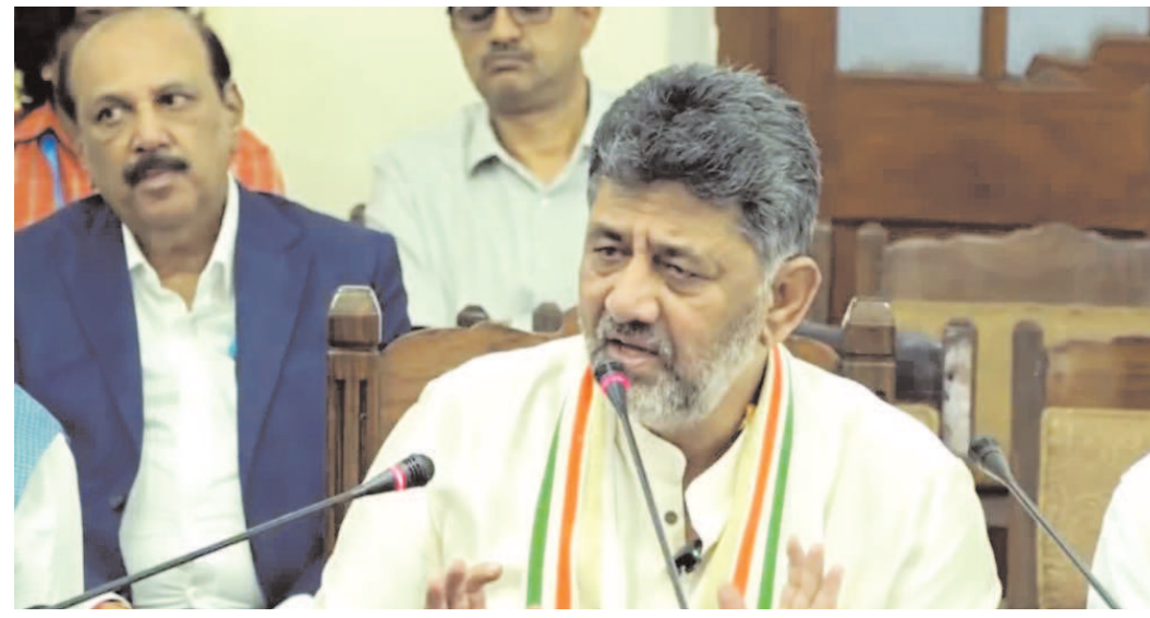
20వేల భారత్ జోడో యువ సంఘాల ఏర్పాటు! యువతలో నాయకత్వ లక్షణాలను పెంపొందించడానికి రాష్ట్ర వ్యాప్తంగా 10వేల భారత్ జోడో యువ సంఘాలను ఏర్పాటు చేస్తున్నట్లు ముఖ్యమంత్రి ప్రకటించారు. ఒక్కో యువ సంఘానికి రూ.10 లక్షలు అందజేస్తామని అన్నారు. ఒక్కో యువజన సంఘంలో రాష్ట్రంలో ప్రతి గ్రామ పంచాయతీ, పట్టణ వార్డుల్లో 150 నుంచి 200 మంది సభ్యులు ఉంటారని సీఎం తెలిపారు. ఆ సంఘాల కార్యకలాపాలు క్రీడలు, సంస్కృతి, విద్య, నాయకత్వ అభివృద్ధిపై కేంద్రీకృతమౌలా ఉంటాయని అన్నారు.

కర్ణాటక రాష్ట్ర ముఖ్యమంత్రిగా బుద్ధవారం బాధ్యతలు తీసుకున్న వెంటనే దేశీ శివకుమార్ తొలి కేబినెట్ సమావేశం నిర్వహించారు. దేశీ అధ్యక్షతన జరిగిన ఈ సమావేశంలో పలు కీలక నిర్ణయాల తీసుకున్నారు. విద్యార్థులకు, నిరుద్యోగులకు ఆయన శుభవార్త చెప్పారు. విద్యార్థులందరికీ డ్రీ టెన్షన్లను ఇప్పుడు ప్రకటించారు. ఈ పాస్?లతో ఆర్టీసీ బస్సుల్లో ఉచితంగానే ప్రయాణించవచ్చని తెలిపారు. అలాగే రాష్ట్రంలో రైతుల వలసలు అరికట్టేందుకు తగిన నిర్ణయాలు తీసుకుంటామని తెలిపారు. వీటితోపాటు దేశీ తొలి కేబినెట్ మీటింగ్?లో ఇతర సంక్షేమ కార్యక్రమాలపైనా నిర్ణయం తీసుకున్నారు. ఆ నిర్ణయాలను ముఖ్యమంత్రి శివకుమార్ వెల్లడించారు. మరీ అంటే? ప్రస్తుతం కర్ణాటకలో ఆర్టీసీ బస్సుల్లో అమాయిలకు, మహిళలకు మాత్రమే ఉచిత ప్రయాణం అమల్లో ఉంది. అయితే ఉచిత ప్రయాణం కోసం యువత నుంచి డిమాండ్ వస్తుంది అందుకే రాష్ట్రంలో విద్యార్థులందరికీ ఉచిత బస్సు పాస్‌లు మంజూరు చేయాలని నిర్ణయించినట్లు చెప్పారు. ఇక ప్రభుత్వ ఉద్యోగాలలో నియమకాల కోసం, త్వరలోనే క్యాంపెయిన్ ప్రకటించామని ఆయన తెలిపారు. ఇందులో ఎన్రోలో చేసుకునేందుకు ప్రైవేట్ ఉపాధి కేంద్రాలను ఏర్పాటు చేస్తామని అన్నారు. దీనికి సంబంధించిన విధివిధానాలను నెల రోజుల్లోగా ఖరారు చేసి, ప్రభుత్వం వీటిని ఏర్పాటు చేస్తుందని చెప్పారు. అలాగే ప్రభుత్వం ఇప్పటికే 56వేల ఉద్యోగాలను ప్రకటించింది సీఎం అన్నారు. తదుపరి కేబినెట్ సమావేశం నాటికి, అన్ని శాఖలతో సమన్వయం చేసుకొని నోటిఫికేషన్లు ఎప్పుడు జారీ చేస్తారు? నియామక ప్రక్రియ ఎలా ఉంటుంది? అనే వివరాలతో ఒక క్యాంపెయిన్ విడుదల చేస్తామని పేర్కొన్నారు. యువతకు నాణ్యమైన విద్య, ఉద్యోగాల కల్పన కోసమే కేబినెట్?లో గంతుకునే చర్చించామని దేశీ అన్నారు.