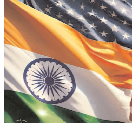
యూఎస్ ట్రేడ్ రిప్రజెంటేటివ్ కు సమర్పించవచ్చు. లిఖితపూర్వక అభ్యర్థనలను 2026 జూలై 6 వరకు సమర్పించవచ్చు. “మాదు నెలల క్రీతమే దర్యాప్తు ప్రారంభం వెట్టిచాకిరి చేసే కార్మికులు తయారుచేసిన వస్తువులను దిగుమతి చేయడం, అదనపు పారిశ్రామిక సామర్థ్యానికి సంబంధించిన ఆందోళనలపై ఇండియా సహా 60 దేశాలపై 2026 మార్చి 11, 12 తేదీలలో రెండు వేర్వేరు సెక్షన్ 301 వివరాలను యూఎస్ ట్రేడ్ రిప్రజెంటేటివ్ ప్రారంభించింది. ఈ క్రమంలో జూన్ 2న కీలక నిర్ణయం తీసుకుంది. వెట్టిచాకిరి కార్మికులు విషయంలో తన దర్యాప్తు వివరాలను విడుదల చేసింది. 60 దేశాలపై అదనపు సుంకాలను విధించాలని అమెరికా ప్రభుత్వానికి ప్రతిపాదిస్తూ నిర్ణయం తీసుకొంది. 54 దేశాలపై 12.5 శాతం, ఆరు దేశాలపై 10 శాతం సుంకాలను విధించాలని బ్రంట్ సర్కారును కోరింది.

వెట్టిచాకిరి చేసే కార్మికులు తయారుచేసిన దిగుమతులను నిషేధించడంలో విఫలమైన భారత్ సహా 60 దేశాలపై అదనపు సుంకాలు విధించాలని యూఎస్ ట్రేడ్ రిప్రజెంటేటివ్ అమెరికా ప్రభుత్వాన్ని ప్రతిపాదించడంపై ఇండియా స్పందించింది. వెట్టిచాకిరి చేసే కార్మికులు, అదనపు పారిశ్రామిక సామర్థ్యానికి సంబంధించిన ఆందోళనలపై సెక్షన్ 301 ప్రోసీడింగ్స్ విషయంలో భారత్ అమెరికాతో సంప్రదింపులు జరుపుతోందని పేర్కొంది. అదే సమయంలో వాషింగ్టన్లో ద్వైపాక్షిక వాణిజ్య ఒప్పందాన్ని ఖరారు చేసే దిశగా కృషి చేస్తోందని పేర్కొంది. ఈ మేరకు కేంద్ర వాణిజ్య, పరిశ్రమల మంత్రిత్వ శాఖ ప్రకటన చేసింది. భారత్ తో సహా 60 దేశాలపై తీసుకున్న చర్యలకు సంబంధించి యూఎస్ ట్రేడ్ రిప్రజెంటేటివ్ దర్యాప్తును పూర్తి చేసిందని కేంద్ర వాణిజ్య, పరిశ్రమల మంత్రిత్వ శాఖ తెలిపింది. ఈ దర్యాప్తుల అనంతరం 1974 నాటి యూఎస్ వాణిజ్య చట్టంలోని సెక్షన్ 301 ప్రకారం ఈ 60 దేశాల దిగుమతులపై అదనపు సుంకాలను విధించాలని అమెరికా ప్రభుత్వాన్ని ప్రతిపాదించింది అయితే ఇప్పటికే సెక్షన్ 232 సుంకాల పరిధిలోకి వచ్చే ఉత్పత్తులతో పాటు, మరీకొన్ని ఇతర వర్గాలను ఈ ప్రతిపాదిత చర్యల నుంచి మినహాయించిందని స్పష్టం చేసింది. “సెక్షన్ 301 ప్రోసీడింగ్స్పై దర్యాప్తు విషయంలో అమెరికాతో భారత్ సంప్రదింపులు కొనసాగిస్తోంది. ఈ ఏడాది ఫిబ్రవరి 2న ప్రకటించినట్లుగా, ఫిబ్రవరి 7 విడుదల చేసిన ఉమ్మడి ప్రకటనకు అనుగుణంగా ఒక ఫ్రీవేర్ ఓబ్బం ద్వారా ఖరారు చేయడానికి కూడా భారత్ సమాంతరంగా అమెరికాతో సంప్రదింపులు జరుపుతోంది. సెక్షన్ 301 కింద యూఎస్ ట్రేడ్ రిప్రజెంటేటివ్ ప్రతిపాదిత టారిఫ్లు ఇంకా ఖరారు కాలేదు. ఆయా దేశాలు 2026 జూన్ 22 వరకు తమ ప్రజాభిప్రాయ సేకరణలో పాల్గొనడానికి అభ్యర్థనలను