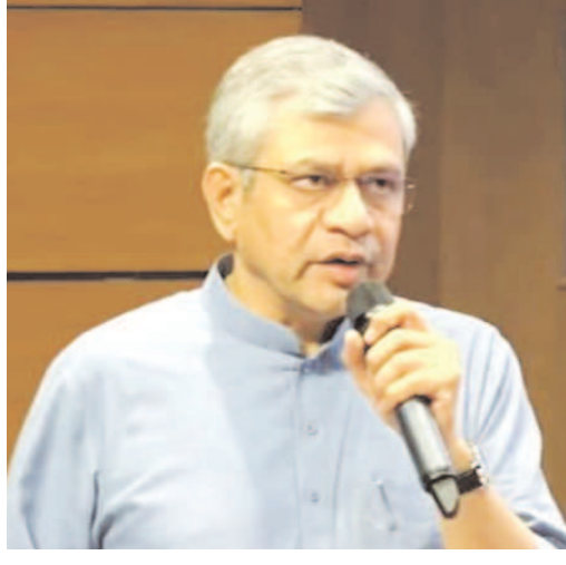
సదుపాయాల కల్పన, ఇంకా ఇలాంటి అనేక ఇతర చర్యలపై ప్రధానంగా దృష్టి సారించారు. అందువల్ల, పాత వాహనాల స్థానంలో ఆధునిక, తక్కువ ఉద్ధారాలు వెలువరించే బీఎన్6, సీఎన్జీ, ఎలక్ట్రిక్ వాహనాలను ప్రవేశపెట్టడానికి ఒక పథకాన్ని రూపొందించారు.

రవాణా రంగం బలోపేతానికి కేంద్ర కేబినెట్ గ్రీన్ సిగ్నల్ ఇచ్చింది. 24,249 కోట్ల పెట్టుబడితో 4 ప్రధాన రహదారి ప్రాజెక్టులకు ఆమోదం లభించింది. ఇందులో తెలంగాణకు చెందిన చీన-63, చీన-563 జాతీయ రహదారుల విస్తరణకు ఆమోదం దక్కింది. ఈ వివరాలను కేంద్ర సమాచార, ప్రసార శాఖ మంత్రి అశ్వినీ వైష్ణవ్ వెల్లడించారు.