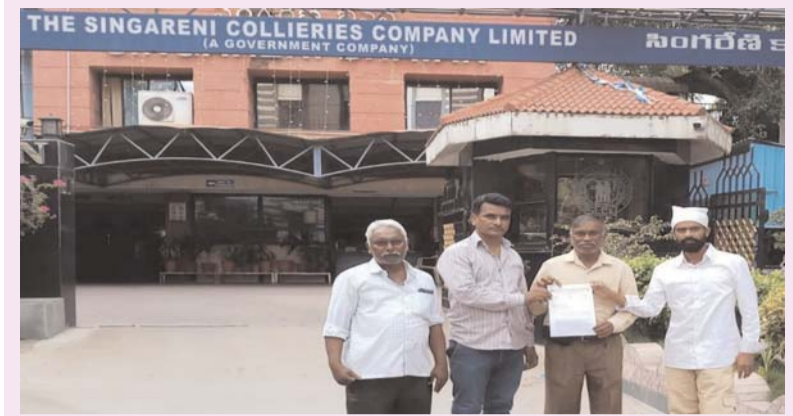
యాజమాన్యానికి గోదావరి లోయ బోర్డుని కార్పొరేట్ యూనియన్ వినతి అగ్నిధార స్టూన్, (రామగుండం):

గోదావరిలోని ఏరియా--1 ఆస్పత్రిలో ప్రతిపాదిత "సింగరేణి కార్పొరేట్ కేర్ సెంటర్" ఏర్పాటును విరమించుకోవాలని గోదావరి లోయ బోర్డుని కార్పొరేట్ యూనియన్ (ఐఎఫ్ఐయూ) సింగరేణి యాజమాన్యాన్ని కోరింది. ఈ మేరకు యూనియన్ నాయకులు సమావేశం చేసి అందరి మేనేజింగ్ డైరెక్టర్ కు వినతిపత్రం అందజేశారు. వినతిపత్రంలో నాయకులు మాట్లాడుతూ.. సింగరేణి ఉద్యోగులు, పెన్షనర్లు, వారి కుటుంబ సభ్యులకు ఏరియా ఆస్పత్రులు ఎన్నో సందర్భాలుగా వైద్య సేవలు అందిస్తున్నాయని పేర్కొన్నారు. ప్రస్తుతం ఏరియా--1 ఆస్పత్రిని "సింగరేణి కార్పొరేట్ కేర్ సెంటర్"గా మార్చే ప్రతిపాదన ఉద్యోగుల్లో ప్రజల అసమానాలు రేపెత్తిస్తోందన్నారు. కార్పొరేట్ కేర్ సెంటర్ పేరుతో వైద్య సేవలను ప్రైవేటీకరించే అవకాశం ఉందనే ఆందోళన కార్పొరేట్ నెలకొంది తెలిపారు. సింగరేణి ఆస్పత్రులు సంస్థ ఉద్యోగులు, పెన్షనర్లు, వారి కుటుంబాల ఆరోగ్య భద్రతకు కీలకమని, వాటి స్వరూపాన్ని దెబ్బతీసే చర్యలు చేపట్టరాదని కోరారు. అదేవిధంగా ఆస్పత్రిలో వైద్యులు, సిబ్బంది ఖాళీలను భర్తీ చేయడంతో పాటు అనుచిత వైద్య పరికరాలు, అవసరమైన సదుపాయాలు కల్పించాలని విజ్ఞప్తి చేశారు. ఉద్యోగులు, పెన్షనర్లు, స్థానిక ప్రజలకు మరింత మెరుగైన వైద్య సేవలు అందాలా చర్యలు తీసుకోవాలని కోరారు. కార్పొరేట్ కేర్ సెంటర్ కు సంబంధించిన ఉద్యోగ సంఘాలు, ప్రజాప్రతినిధులు, ప్రజల అభిప్రాయాలను పరిగణనలోకి తీసుకుని నిర్ణయం తీసుకోవాలని యాజమాన్యానికి సూచించారు. ఈ అంశపై కార్పొరేట్ ఆందోళనలను గౌరవించి తగిన చర్యలు చేపట్టాలని విజ్ఞప్తి చేశారు. ఈ కార్యక్రమంలో యూనియన్ గౌరవాధ్యక్షులు ఆర్.కె.పి, రాష్ట్ర అధ్యక్షుడు కె. విశ్వనాథ్, రాష్ట్ర ఉపాధ్యక్షుడు విజయ్, రాష్ట్ర ప్రధాన కార్యదర్శి కె. సురేందర్ తదితరులు పాల్గొన్నారు.