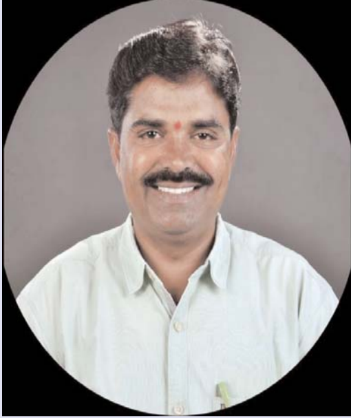
కేవలం గణాంకాల్లో కనిపించే సంఖ్యలు మాత్రమే కాదు. ప్రతి

తెలంగాణ అవిచ్ఛిన్నత దినోత్సవం అనేది కేవలం ఒక రాష్ట్రం ఏర్పడిన రోజును గుర్తు చేసుకునే సందర్భం మాత్రమే కాదు. ఇది అత్యగౌరవం కోసం సాగిన ఉద్యమానికి, వేలాది మంది త్యాగాలకు, కోట్లాది ప్రజల ఆకాంక్షలకు ప్రతీక. జూన్ 2 తెలంగాణ చరిత్రలో ఒక మలుపు. ఈ రోజు తెలంగాణ ప్రజల కలలు సాకారమైన రోజు. ప్రత్యేక రాష్ట్ర సాధన కోసం విద్యార్థులు, యువత, రైతులు, ఉద్యోగులు, మేధావులు, ప్రజాసంఘాలు కలిసి చేసిన పోరాటం భారత ప్రజాస్వామ్య చరిత్రలో ఒక విశిష్ట అధ్యాయం. ఆ ఉద్యమం కేవలం భౌగోళిక విభజన కోసం జరగలేదు. సామాజిక న్యాయం, సమాన అవకాశాలు, స్వయం పాలన, ప్రాంతీయ అభివృద్ధి వంటి లక్ష్యాలతో ముందుకు సాగింది. రాష్ట్ర అవిచ్ఛిన్నత తర్వాత తెలంగాణ అనేక రంగాల్లో అభివృద్ధి దిశగా అడుగులు వేసింది. సాగునీటి ప్రాజెక్టులు, గ్రామీణాభివృద్ధి, తాగునీటి సదుపాయాలు, మౌలిక వసతులు, సంక్షేమ పథకాల అమలులో గణనీయమైన పురోగతి కనిపించింది. హైదరాబాద్ ప్రపంచ స్థాయి పెట్టుబడులను ఆకర్షిస్తూ దేశ ఆర్థిక వృద్ధికి ఒక ప్రధాన కేంద్రంగా ఎదిగింది. అయితే అభివృద్ధి అనేది