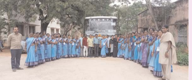
అగ్ని ధార స్పూస్ (కల్వకుర్తి)