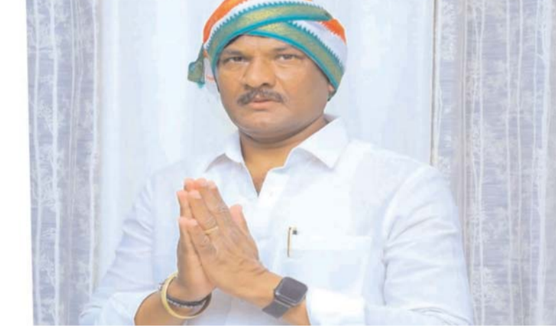
అగ్ని ధార స్పూస్ (కల్వకుర్తి)