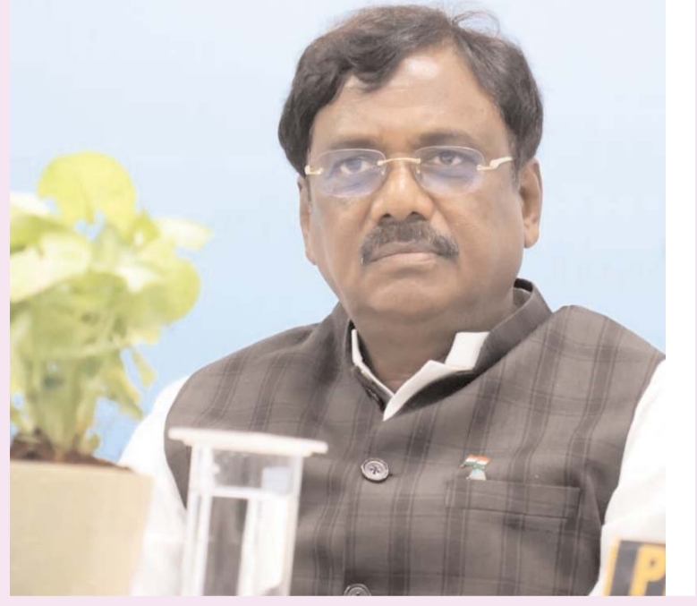
జర్నల్ భాషా శిక్షణ కేంద్రం ప్రారంభం నుంచి బస్టి దవాఖాన ప్రారంభోత్సవం వరకు పలు కార్యక్రమాల్లో పాల్గొననున్న మంత్రి అగ్ని ధార స్పూస్, (చుంచెర్యాల):