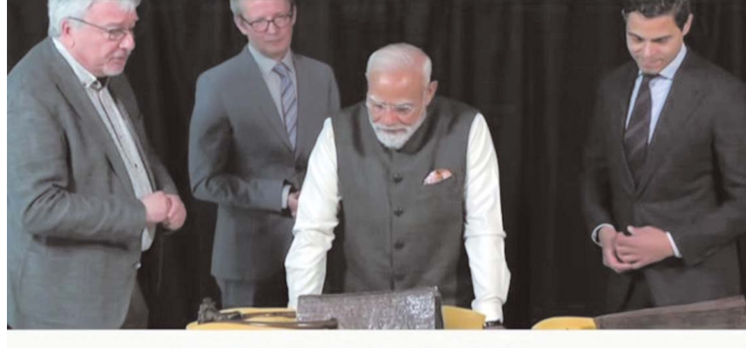
ANCIENT COPPER PLATES FROM THE CHOLA PERIOD...

అందిస్తాయి. చోళ సామ్రాజ్యం గొప్ప చరిత్ర, సంస్కృతి మనందరికీ గర్వకారణం. అటువంటి అమూల్యమైన వారసత్వ సంపదను పరిరక్షించడానికి మా ప్రభుత్వం నిరంతరం కృషి చేస్తోంది.” ఖగోళ శాస్త్రం తరతరాలుగా భారతీయులను ఆకర్షించింది, గ్రామీణ ప్రాంతాల్లో ఈ విషయాన్ని ప్రాచుర్యంలోకి తీసుకురావడానికి బెంగళూరు ఖగోళ సాస్ట్రో ఒక కార్యక్రమాన్ని ప్రారంభించింది మోడి నొక్కి చెప్పారు. అలాగే, రాత్రిపూట నక్షత్రాలను చూడటం అనేది ఒక అద్భుతమైన అనుభవమని, ఆస్ట్రో కేరళ అనే సంస్థ రాత్రిపూట పరిశీలన శిబిరాలు, వర్షాపాతం నిర్వహిస్తుందని ఆయన చెప్పారు. అక్కడి యువత టెలిస్కోపులు తయారు చేయడం, నక్షత్ర పటాలను ఉపయోగించడం నేర్చుకుంటున్నారని అన్నారు. “రాజ్ కోట్లోని బిగ్ బ్యాంగ్ ఆస్ట్రోనమీ క్లబ్ గర్ అదవుల నుంచి రాన్ ఆఫ్ కన్ వరకు అనేక ఖగోళ శాస్త్ర కార్యక్రమాలను నిర్వహించింది” అని మోడి అన్నారు.