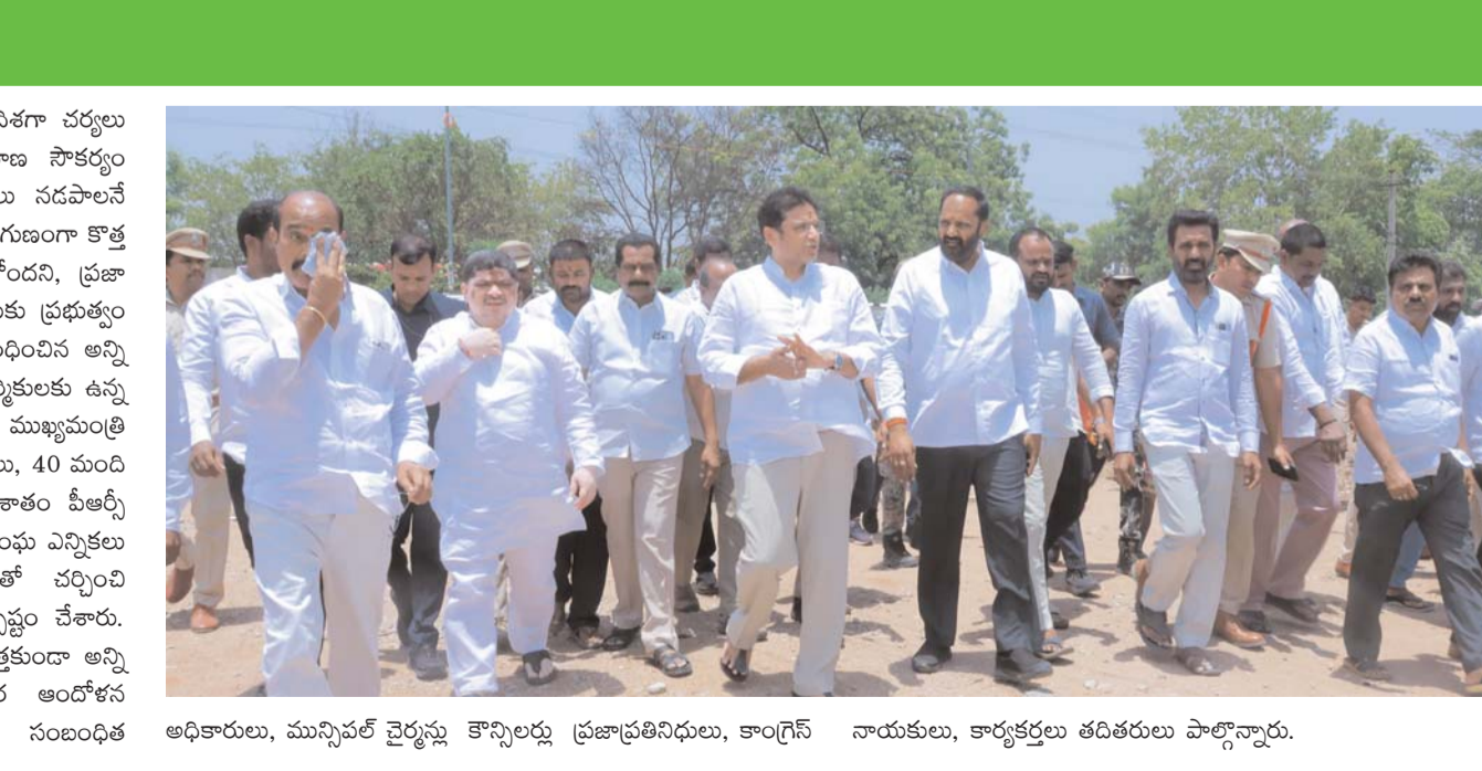
అధికారులు, మున్సిపల్ చైర్మన్లతో కలిసి రాష్ట్ర ప్రజాప్రతినిధులు, కాంగ్రెస్ నాయకులు, కార్యకర్తలు తదితరులు పాల్గొన్నారు.

ప్రాంతాలకు బస్సు కనెక్టివిటీని మరింత మెరుగుపరిచే దిశగా చర్యలు తీసుకుంటున్నామని, మహిళలకు ఉచిత బస్సు ప్రయాణ సౌకర్యం అమల్లోకి వచ్చిన తర్వాత గ్రామాలకు ఆర్టీసీ బస్సులు నడపాలనే డిమాండ్ పెరిగిందని తెలిపారు. ప్రజల అవసరాలకు అనుగుణంగా కొత్త ఆర్టీసీ బస్సుల కొనుగోలు ప్రక్రియ కూడా కొనసాగుతోందని, ప్రజా రవాణా వ్యవస్థలో ఆర్టీసీని మరింత బలోపేతం చేసేందుకు ప్రభుత్వం కృషి చేస్తోందని పేర్కొన్నారు. ఆర్టీసీ కార్మికులకు సంబంధించిన అన్ని సమస్యలను పరిష్కరిస్తామని మంత్రి హామీ ఇచ్చారు. కార్మికులకు ఉన్న అపోహలను తొలగించుకోవాలని సూచించారు. ఉప ముఖ్యమంత్రి నాయకత్వంలో బదుగురు మంత్రులు, సీనియర్ అధికారులు, 40 మంది ఆర్టీసీ ప్రతినిధులతో చర్యలు జరిపి కార్మికులకు 11 శాతం పీఆర్సీ మంజూరు చేసినట్లు తెలిపారు. ఆర్టీసీ గుర్తింపు కార్మిక సంఘ ఎన్నికలు త్వరలో నిర్వహించనున్నామని, ఎన్నికైన ప్రతినిధులతో చర్చించి భవిష్యత్తులో ఆర్టీసీ విలీన ప్రక్రియను చేపట్టనున్నట్లు స్పష్టం చేశారు. విలీన ప్రక్రియలో ఎలాంటి వివాదాలు, అడ్డంకులు తలెత్తకుండా అన్ని జాగ్రత్తలు తీసుకుంటున్నామని, కార్మికులు అనవసర ఆందోళన చెందవద్దని మంత్రి తెలిపారు. ఈ కార్యక్రమంలో సంబంధిత