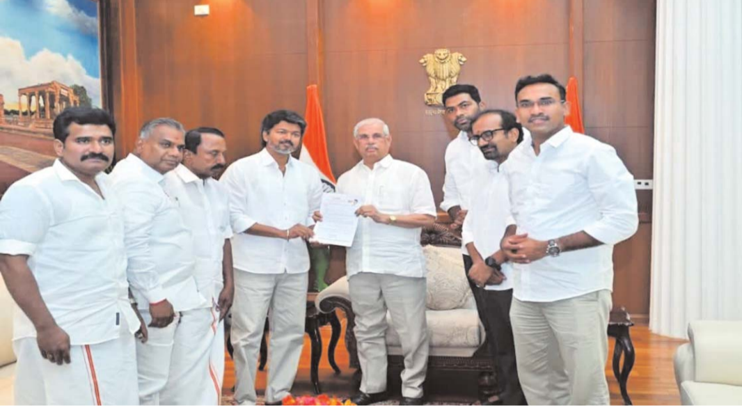
ప్రమాణస్వీకారానికి రాహుల్ గాంధీని ఆహ్వానించిన విజయ్

అసెంబ్లీ ఎన్నికల్లో విజయ్ పార్టీకి 108 సీట్లు రాగా ప్రభుత్వ ఏర్పాటుకు మరో 10 సీట్లు అవసరం ఉంది. ఈ నేపథ్యంలో తమిళ మైత్రి కళగం (టీవీకే) పార్టీకి షరతులతో కూడిన మద్దతు ఇస్తున్నట్లు కాంగ్రెస్ ప్రకటించింది. ఇందుకు సంబంధించి తమిళనాడు కాంగ్రెస్ ఇంకా ఖరీదే చోడంకర్ సంతకం చేసిన ఓ లేఖను అధికారికంగా విడుదల చేసింది. లోకీక ప్రభుత్వాన్ని ఏర్పాటు చేయడంలో టీవీకే అధినేత విజయ్కు మద్దతు ఇవ్వాలని తమిళనాడు కాంగ్రెస్ నిర్ణయించిన నట్లు సంబంధిత వర్గాలు తెలిపాయి. అంతకుముందు మంగళవారం రాత్రి తమిళనాడు కాంగ్రెస్ రాజకీయ వ్యవహారాల కమిటీలూజా అత్యవసరంగా సమావేశమై నిర్ణయం తీసుకుంది. బీజేపీ, దాని మిత్ర పక్షాలు ఎట్టి పరిస్థితుల్లో తమిళనాడులో అధికారం చేపట్టకుండా అడ్డుకునేందుకు కృతనిశ్చయంతో ఉన్నామని కాంగ్రెస్ చెప్పింది. అనంతరం కాంగ్రెస్ ఎమ్మెల్యేలు చెన్నైలోని టీవీకే ప్రధాన కార్యాలయానికి వెళ్లి విజయ్తో సమావేశమయ్యారు. వాళ్లందరినీ విజయ్ శాలువాలతో సత్కరించారు. ఐదుగురు సభ్యులు ఉన్న కాంగ్రెస్ మద్దతు ఇచ్చినప్పటికీ టీవీకేకు మరో ఐదుగురు ఎమ్మెల్యేల మద్దతు అవసరం ఉంది. ఈ నేపథ్యంలో అన్నాడీఎంకే కూటమిలోని పీఎంకే కూడా విజయ్కు మద్దతు ఇచ్చేందుకు సిద్ధమైంది. పీఎంకేకు నలుగురు ఎమ్మెల్యేలు ఉన్నారు.