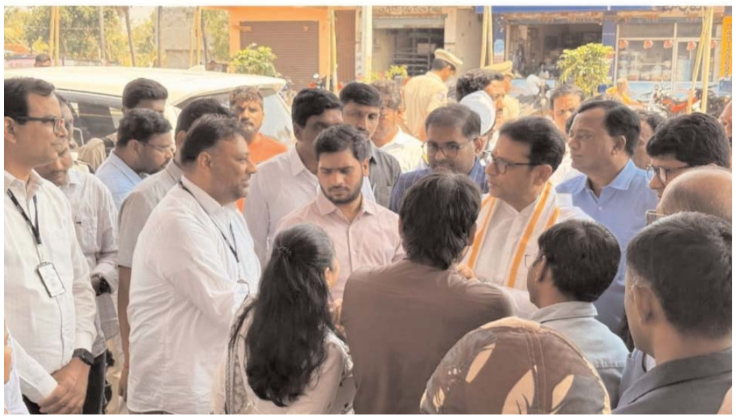
ప్రాంతాల యువత ఈ కార్యక్రమంలో సాగునీటి ప్రజా ప్రదర్శనలు, నాయకులతో ఉపాధి అవకాశాల పొందాలని ఆకాంక్షిస్తున్నారని పేర్కొన్నారు.