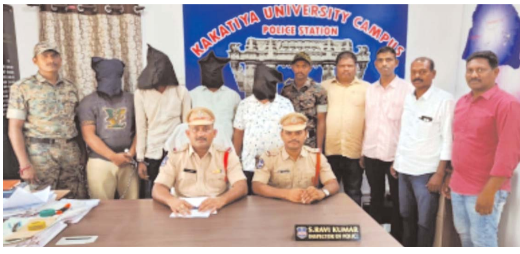
ఫిర్యాదు మేరకు పోలీసులు కేసు నమోదు చేసి, వేగవంతంగా దర్యాప్తు చేపట్టారు. కేవలం కొన్ని గంటల్లోనే గిర్మిబావి ప్రాంతంలో నిందితులను అదుపులోకి తీసుకున్నారు. వారి వద్ద నుండి 89 గోవులు, ఇన్సూవా కారు, బ్రెజ్జా కారు, పశువుల రవాణా కోసం ఉపయోగించిన కలెక్టర్ లారీని స్వాధీనం చేసుకున్నారు. అరెస్ట్ అయిన నిందితులు