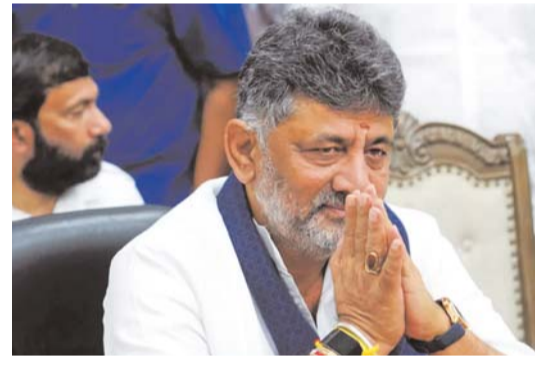
అందుబాటులో ఉండనే ఉద్దేశంతోనే, సీఎల్సీ సమావేశానికి ముందే డి.కే ఆయనతో ఛేదీ అయినట్లు పార్టీ వర్గాలు తెలిపాయి.

కర్ణాటక తదుపరి ముఖ్యమంత్రిగా డి.కే శివకుమార్ పగ్గాలు చేపట్టనున్నారు. శనివారం సాయంత్రం బెంగళూరులో జరిగిన కాంగ్రెస్ శాసనసభావర్ష సమావేశంలో సీఎల్సీ నేతగా డి.కే శివకుమార్ ఏకగ్రీవంగా ఎన్నికయ్యారు. మాజీ సీఎం సిద్దరామయ్య డి.కే పేరును ప్రతిపాదించగా ఎమ్మెల్యేలంతా సమర్థించారు. దీంతో కర్ణాటక కాంగ్రెస్ సీఎల్సీ నేతగా డి.కే శివకుమార్ ఏకగ్రీవంగా ఎన్నికైనట్లు విఠనీసీ పరిశీలకులు ప్రకటించారు. అయితే కేవలం పది నిమిషాల్లోనే సీఎల్సీ ఛేదీ ముగియడం గమనార్హం.