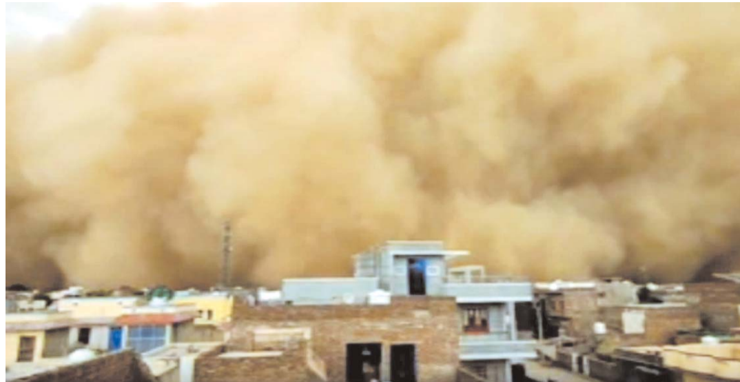
ఉండాలని, అనవసర ప్రయాణాలు వద్దని శనివారం సూచించింది.

మరో 4-5 రోజులపాటు ఇదే పరిస్థితి వెస్ట్రన్ డిప్రెషన్ వల్ల రాజస్థాన్ లో మరో 4, 5 రోజులపాటు ఇదే విధంగా ఉరుములు, మెరుపులతో కూడిన వర్షాలు పడతాయని వాతావరణ శాఖ (ఐఎంఓ) తెలిపింది. అదే సమయంలో ఇసుక తుపానులు కూడా కొనసాగే అవకాశం ఉందని పేర్కొంది. అందువల్ల ప్రజలు అప్రమత్తంగా