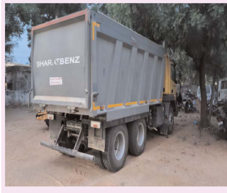
అగ్ని ధార స్పృహ (కల్పకుర్తి)