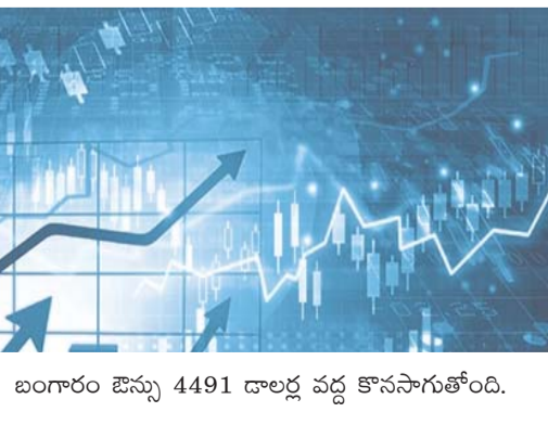
బంగారు బెన్సు 4491 డాలర్ల వద్ద కొనసాగుతోంది.

కోలుకుని 117.54 పాయింట్ల లాభంతో 75,318.39 వద్ద ముగిసింది. నిష్ఠి సైతం 41 పాయింట్ల లాభంతో 23,659 వద్ద స్థిరపడింది. దాలరుతో రూపాయి మారకం విలువ 96.83గా ఉంది. సెన్సెట్టివ్ 30 సూచీలో రిలయన్స్ ఇండస్ట్రీస్, బజాజ్ ఫిన్ సర్వీస్, ట్రెంట్, ఇండిగో, యాక్సిస్ బ్యాంక్ షేర్లు లాభాల్లో ముగిశాయి. బీజేఎల్, టెక్ మహేంద్రా, ఎటెర్నల్, టాటా స్టీల్, హిందుస్థాన్ యూనిలివర్ షేర్లు నష్టాలు చవిచూశాయి. అంతర్జాతీయ వివశిత్రో ట్రెంట్ క్రూడ్ బ్యారెల్ ధర 109 డాలర్ల వద్ద ట్రేడవుతుండగా..