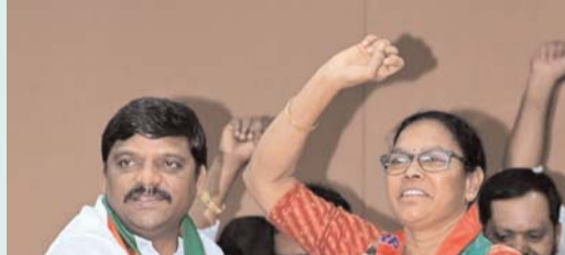
టి ఆర్ పి రాజకీయ కీలక నిర్ణయాలు