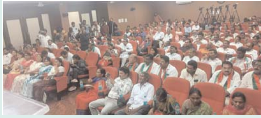
అసన్నమైందని స్పష్టం చేశారు.

టి ఆర్ పి వ్యవస్థాపక అధ్యక్షులు తీవ్రస్థాయిలో పెద్ద సంఖ్యలో టి ఆర్ పి లో చేరిన మాజీ మావోయిస్టులు మల్లన్న ప్రసంగంతో ఆధిపత్య రాజకీయ పార్టీల్లో ఆందోళన టి ఆర్ పి రాష్ట్ర అధ్యక్షురాలుగా పవిత్ర పంజా తెలంగాణ రాజ్యాధికార పార్టీలో సంచలన రాజకీయ పరిణామం అడవి జిల్లాల అందరితో రాజ్యాధికారం దిశగా మాజీ మావోయిస్టుల భారీ చేరికలు