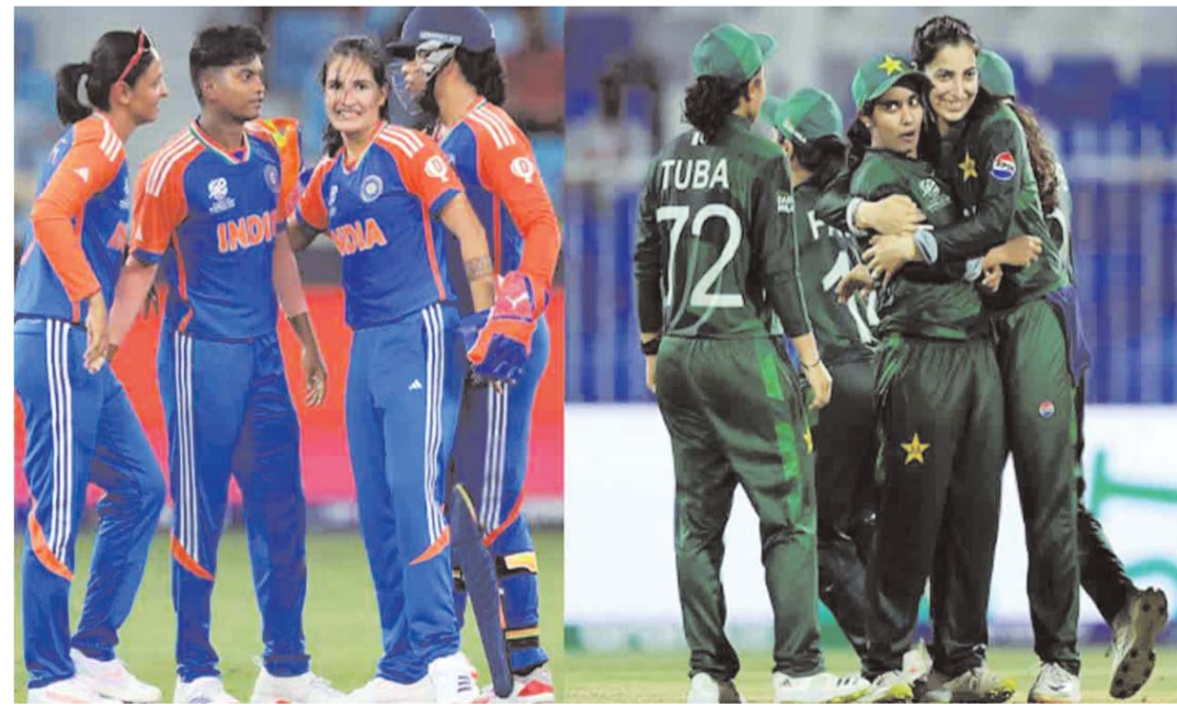
మొదలవుతుంది. అంతకు ముందు బర్మాండ్, పాకిస్థాన్, వెస్ట్ ఇండీస్ ముక్కోణపు సిరీస్ లో తలపడనున్నాయి. ఈ మూడు జట్ల మధ్య డబ్లిన్ లో మే 28 నుంచి జూన్ 4 వ తేదీ ఈ సిరీస్ జరుగుతుంది. ప్రపంచకప్ లో దేశ తొలి మ్యాచ్ లో పాకిస్థాన్ జూన్ 14న భారత జట్టును ఢీకొట్టుతుంది. జూన్ 17న దక్షిణాఫ్రికాతో, జూన్ 20 వ తేదీన బంగ్లాదేశ్ తో, జూన్ 23న ఆస్ట్రేలియా, జూన్ 27వ తేదీన నెదర్లాండ్స్ తో తలపడనుంది.