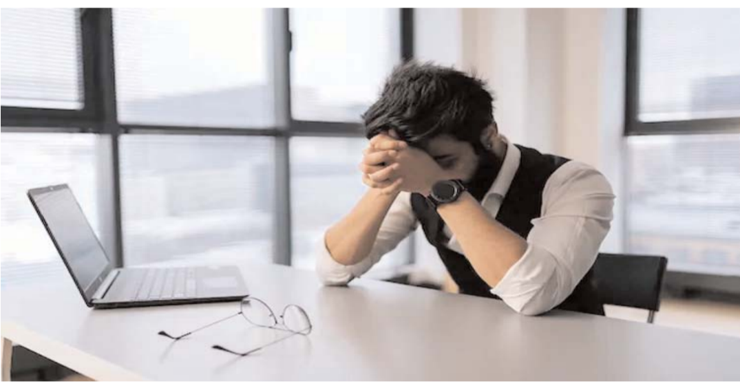
పాతకాలపు ఆలోచన అని విమర్శించారు. నేటి డిజిటల్ కాలంలో సమాచారం ఎప్పుడైనా, ఎక్కడైనా చేరవచ్చు. కాబట్టి, కేవలం అఫీసుల మధ్య దూరం ఆధారంగా గోప్యత భంగం కలుగుతుందని భావించడం సరైనది కాదని అన్నారు.

ఈ మధ్యకాలంలో ఉద్యోగ నియామక ప్రక్రియలో విచిత్రమైన సంఘటనలు వెలుగులోకి వస్తున్నాయి. ఇందులో భాగంగానే ఒక ఉద్యోగ అభ్యర్థికి వచ్చిన రిజెక్షన్ మెయిల్ అందరి దృష్టిని ఆకర్షించింది. సాధారణంగా కంపెనీలు అభ్యర్థిని తిరస్కరించేటప్పుడు.. క్యాలిఫికేషన్, స్కిల్స్ వంటివి చూస్తాయి. తమకు అవసరమైన స్కిల్ ఉన్నవారిని ఎంపిక చేసుకుంటాయి. లేకుంటే రిజెక్ట్ చేస్తాయి. కానీ.. అభ్యర్థి పనిచేసిన పాత ఆఫీస్ 600 మీటర్ల దూరంలో ఉండటం వల్ల రిజెక్ట్ చేస్తున్నట్లు కంపెనీ మెయిల్ ద్వారా వెల్లడించింది. కంపెనీకి సంబంధించిన భద్రతను దృష్టిలో ఉంచుకుని ఈ నిర్ణయం తీసుకున్నట్లు పేర్కొంది. ఈ కారణం చదివిన తరువాత చాలా మంది ఆశ్చర్యపోయారు. సాధారణంగా కంపెనీలలో గోప్యత అనేది ఉద్యోగి భాధ్యత. కాబట్టి దీనికి కొన్ని సెక్యూరిటీ పాలసీలు ఉంటాయి. కానీ.. కేవలం భౌగోళిక దూరం ఆధారంగా ఉద్యోగిని తిరస్కరించడం అనేది చాలా మందికి అర్థం కాని విషయం అయ్యింది. సోషల్ మీడియాలో ఈ పోస్ట్ వైరల్ అయిన తరువాత, చాలామంది వినియోగదారులు దీనిపై తమ అభిప్రాయాలు వ్యక్తం చేశారు. కొందరు ఇది