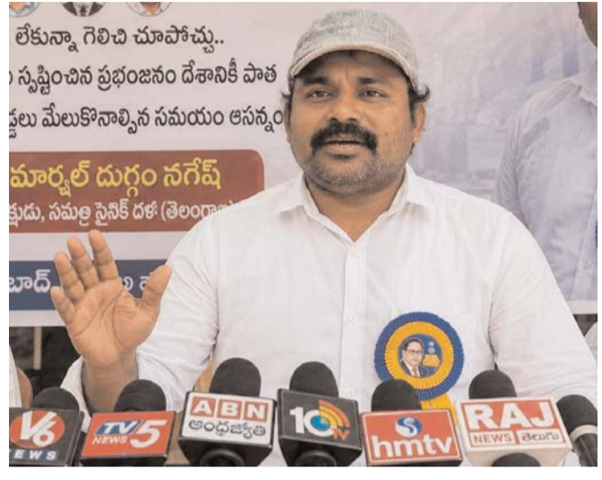
అమ్మకునే కుట్రగా ఆయన అభివర్ణించారు. కోట్ల రూపాయల కోవింగ్ మాఫియా, అవినీతి అధికారులు, రాజకీయ ఆశ్రయం కలిసిపోవడంతోనే ఈ దుస్థితి ఏర్పడిందని పేర్కొన్నారు. "పేద, మధ్యతరగతి కుటుంబాలకు చెందిన విద్యార్థులు రాల్సిందివల్ల కష్టపడి చదువుతుంటే, దబ్బున్నవారికి ముందుగానే