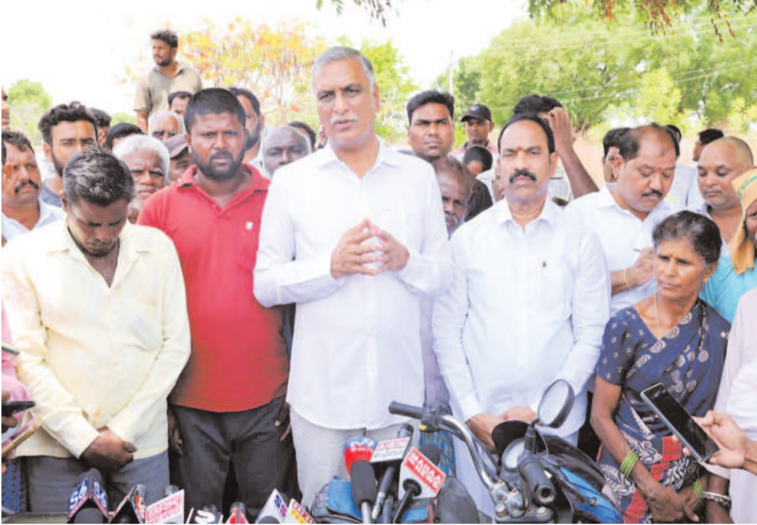
రాలేడు. అనాడు కేసీఆర్ కాళేశ్వరం జలాలతో బంగారం లాంటి పంటలు పండిస్తే.. కొనేవాడు లేక ఆ పంట అమ్ముకోవడం రైతులకు కష్టమైపోయింది. సాధారణంగా రోజూకే కారె నాటికి వడ్లు కొనుగోళ్లు పూర్తవుతాయి. కానీ ఈ ప్రభుత్వం ఆన్ లైన్ ట్యాగింగ్, కొత్త రూల్స్ పేరుతో నెల రోజులు కాలయాపన చేయడం వల్లే నేడు ఈ దుస్థితి దావరించింది. ప్రభుత్వానికి రైతుల ముఖ్యమూ ఇకను మీద వచ్చే ఆదాయం ముఖ్యమూ తేల్చుకోవాలి.

సిద్దిపేట : సిద్దిపేట జిల్లా చిన్నకొడూరు మండల కేంద్రంతో పాటు గోనపల్లి, ఇబ్రహీంనగర్ గ్రామాలలోని వడ్లు కొనుగోలు కేంద్రాలను మాజీ మంత్రి, బీజేపీ ఎన్ డిప్యూటీ ఛోసే బీదర్ హరీష్ రావు సందర్శించారు. అకాల వర్షాలకు తడిసిన ధాన్యాన్ని ఆయన క్షేత్రస్థాయిలో పరిశీలించారు. కొనుగోలు కేంద్రాల్లో కనీసం పెట్టుకుంటున్న రైతులను కలిసి..అధ్యక్షులతో కలిసి, అందగా ఉండి కొట్టాడతామని భరోసా ఇచ్చారు. ప్రభుత్వం సకాలంలో వడ్లు కొనకపోవడం వల్లే ఆరుగూలం వండించిన పంట తడిసి ముద్దయిందని ఆగ్రహం వ్యక్తం చేశారు. అనంతరం ఆయన మీడియాతో మాట్లాడారు. ధికారంలో ఉన్న కాంగ్రెస్, బీజేపీ ప్రభుత్వాలను తమ బాధ్యతలను విస్మరించి రైతులను మోసపుచ్చుతూ నాలుకాలు ఆడుతున్నాయి. వడ్లు, మక్కులు, సస్ ఫ్లవర్, శనగలు, జొన్నలు కొనమంటే కాంగ్రెస్ నాయకులు కేంద్రం మీద నెపం నెదురున్నారు. మరోవైపు కేంద్రంలో అధికారంలో ఉండి కూడా బీజేపీ వాళ్లు వడ్లు కొనాలని ఇక్కడ ధర్మాలు చేస్తున్నారు. డిజిల్, పెట్రోల్ ధరలు పెరిగాయని ఇక్కడ అధికారంలో ఉన్న కాంగ్రెస్ వాళ్లు రోడ్లకు తూర్పునూ, కేంద్ర ప్రభుత్వం ఎఫ్ సీబి రెవెన్యూ కోటాను, ఎరువుల కోటాను రాష్ట్రానికి సకాలంలో ఇవ్వకుండా బీజేపీ మోసం చేస్తుంటే, రాష్ట్రంలో కాంగ్రెస్ సర్కార్ రైతులను గాలికి వదిలేసి ఇద్దరూ కలిసి ప్రజలను ఇబ్బందుల పాలు చేస్తున్నారు. గత వదేళ్ల బీఆర్ఎస్ పాలనలో ఎరువులకు, వడ్లు కొనుగోళ్లకు ఏనాడూ ఇబ్బంది