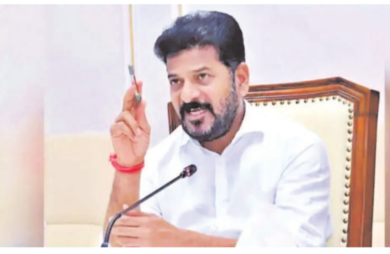
గ్రామ పంచాయతీల స్వతంత్రతను నిర్వహించేస్తూ గత ప్రభుత్వం తొలగించిన నిబంధనలను పునరుద్ధరించేందుకు చర్యలు తీసుకోవాలన్నారు. తెలంగాణ పంచాయతీ రాజ్ చట్టం, 2018 లోని సెక్షన్ 70 3 ప్రతిపాదిత సవరణ ప్రకారం గ్రామ పంచాయతీ సొంత ఆదాయాన్ని బ్రెజిల్ ఖాతాలో కాకుండా బ్యాంకు ఖాతాలో జమ చేసే విధంగా

హైదరాబాద్ : పింఛన్ ల విషయంలో తెలంగాణ సీఎం రేవంత్ రెడ్డి కీలక నిర్ణయం తీసుకున్నారు. పింఛన్లను నేరుగా లబ్ధిదారుల ఖాతాలో జమ చేయాలని ఆదేశించారు. అలాగే అర్హులకే పింఛన్లు ఇవ్వాలని ఆదేశించారు. ఈ మేరకు గ్రామీణాభివృద్ధి శాఖపై ఉన్నతాధికారులతో ముఖ్యమంత్రి రేవంత్ రెడ్డి సమావేశం నిర్వహించారు. ఈ సందర్భంగా అధికారులకు పలు కీలక సూచనలు చేశారు. గ్రామ పంచాయతీ సిబ్బంది జీతాలు చెల్లించడానికి ప్రభుత్వం నుంచి ప్రతినెలా రూ. 50 కోట్లు ప్రత్యేకంగా నిధులు మంజూరు చేస్తామని తెలిపారు. అప్పట్లోనింగ్, కాంట్రాక్ట్ ఉద్యోగులు అని తేడా లేకుండా ప్రభుత్వంలోని అన్ని శాఖల పరిధిలోని ఉద్యోగులకు మొదటి తారీఖునే జీతాలు అందేలా చూడాలని ఈ మేరకు స్పష్టం చేశారు. సిబ్బంది జీతాలు ఒక్కరోజు ఆలస్యమైనా సహించబోమని పేర్కొన్నారు. రాష్ట్రంలోని 50 వేల మంది గ్రామ పంచాయతీ సిబ్బందికి ప్రతి నెలా మొదటి తారీఖునే జీతాలు చెల్లించేలా అవసరమైన చర్యలు తీసుకోవాలని సందంధిత అధికారులను ఆదేశించారు. ఐఏఎస్ అధికారులకు ప్రతి నెలా సమయానికి జీతాలు అందినట్లే గ్రామ పంచాయతీ సిబ్బందికి కూడా వేతనాలు అందాలని ఈ మేరకు స్పష్టం చేశారు. సొంత ఆదాయంపై