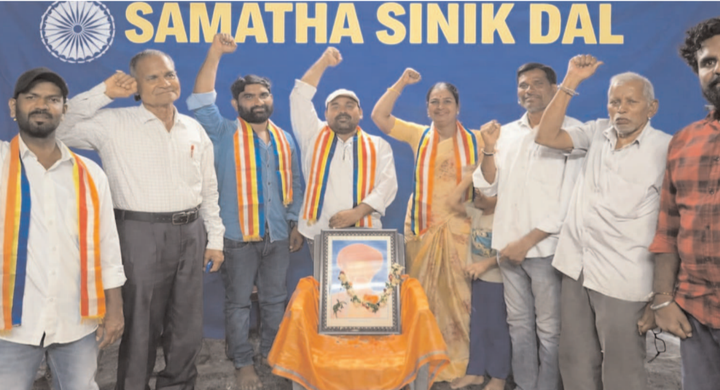
అన్యాయాలను బహిష్కరణ చేశారని పేర్కొన్నారు. పూలే ఆలోచనలు డాక్టర్ బి.ఆర్. అంబేద్కర్ సూర్తిగా నిలిచాయని, సామాజిక ప్రజాస్వామ్యం లేకుండా రాజకీయ ప్రజాస్వామ్యం నిలవదన్న భావనకు పునాది ఆయన సిద్ధాంతాలేనని వివరించారు. ప్రస్తుత సమాజంలో కుల, మత విభజనలు కొనసాగుతున్న నేపథ్యంలో పూలే ఆలోచనలు మరింత ప్రాసంగికమని అన్నారు. పూలే మార్గంలో నడవడం ద్వారానే