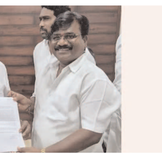
ఏరియాలో షాపింగ్ కాంప్లెక్స్ నిర్మాణం వెంటనే పూర్తి చేయించాలని కోరారు.

అధికారులపై చర్యలు తీసుకోవాలని కోరారు. అలాగే అదే ఏరియాలో ప్రధాన కాలువ నిర్మాణం చేపట్టి పనులను సగంలోనే ఆపివేసిన కాంట్రాక్టర్ పై అధికారులు చర్యలకు వెనుకాడుతున్నారని తెలిపారు. దీనితో ప్రజలు తీవ్ర ఇబ్బందులకు గురవుతున్నారని పేర్కొన్నారు. త్వరితగతిన ఈ ప్రధాన సమస్యలను పరిష్కరించి కాంట్రాక్టర్ పై చర్యలు తీసుకోవాలని కోరారు. అలాగే రైల్వే స్టేషన్