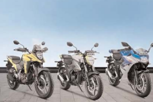
దాని ప్రీమియం మోడల్లు, వివిధ విభాగాలలో దాని ఉనికిని మరింత బలోపేతం చేశాయి.

టవ్ మోయింట్లతో కూడిన విస్తృత నెట్వర్క్ను నిర్వహిస్తోంది. భారతదేశంలో దీని ప్రయాణం 2006లో సుజాకి హీల్ 125 మరియు సుజాకి జీయస్ 125 వంటి మోటార్ సైకిళ్లతో ప్రారంభమైంది. ఆ తర్వాత 2007లో సుజాకి యాక్సిస్ 125ను విడుదల చేశారు. ఈ మోడల్ అమ్మకాలలో కీలక పాత్ర పోషించి, 125ఎంఎ మోటార్ సైకిల్లోకి సహాయపడింది. కాలక్రమేణా.. సుజాకి గిగ్గర్ సిరీస్, సుజాకి వి-స్ట్రోమ్ ౨౦ వంటి మోటార్ సైకిళ్లతో పాటు, సుజాకి బ్లైజ్ సిరీస్, సుజాకి అవెనిస్ వంటి ఉత్పత్తులతో సుజాకి తన పోర్ట్ ఫోలియోను మరింతగా ముందుకు తీసుకెళ్లాయి. సుజాకి హుబ్బుసా, సుజాకి ౫౫౦-8= వంటి