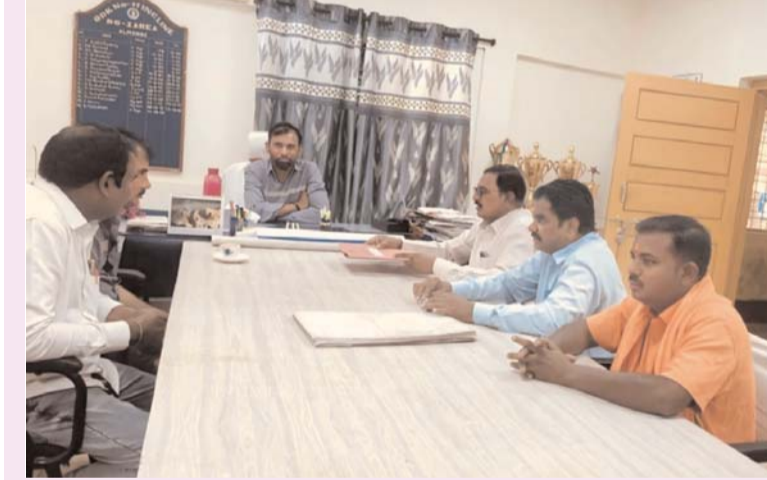
కార్మిక సమస్యలపై మేనేజర్తో ఏజిలీ యూసీ నాయకుల చర్చ