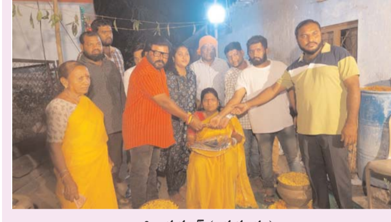
అగ్ని ధార స్టూన్స్, (రామగుండం):