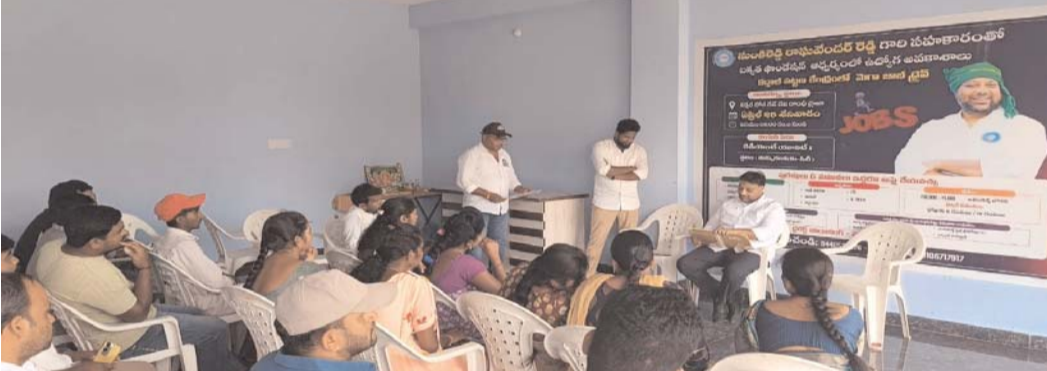
చేపడుతున్నామని, నిరుద్యోగ సమస్య పరిష్కారం కోసం ఒకవైపు ఉచిత ఎస్ఐ ౧ కానిస్టేబుల్ శిక్షణ కేంద్రాలు నిర్వహిస్తూ, మరోవైపు ప్రైవేట్ రంగ ఉద్యోగ అవకాశాల కోసం జాల్ మేళాలు ఏర్పాటు చేయడం ద్వారా యువతకు రెండు విధాలుగా అందగా నిలుస్తున్నామని పేర్కొన్నారు. ప్రస్తుతం ఉద్యోగాల కోసం యువత ఎదుర్కొంటున్న ఇబ్బందులను దృష్టిలో ఉంచుకొని, వల ఎలక్ట్రానిక్ కంపెనీ ప్రతినిధులతో పలు దఫాలుగా చర్చలు జరిపి నిరుద్యోగ యువతకు అందగా ఉండేందుకు తన వంతు ప్రయత్నంగా వలు జాల్ మేళా కార్యక్రమాలు నిర్వహిస్తూ ముందుకు సాగుతున్నాం అని, 42 మంది నిరుద్యోగులకు ఇంటర్వ్యూ ప్రక్రియ విజయవంతంగా పూర్తి చేసుకొన్నారని, జాయినింగ్ ప్రక్రియ త్వరలో పూర్తి అవుతుందని, భవిష్యత్తులో మరిన్ని మండలాల్లో ఇలాంటి జాల్ మేళాలు నిర్వహిస్తామని తెలిపారు. ఈ కార్యక్రమంలో రేడియంట్ 1 సంస్థ ప్రతినిధుల బృందంతో పాటు బక్కత ఫౌండేషన్ సభ్యులు తదితరులు పాల్గొన్నారు.