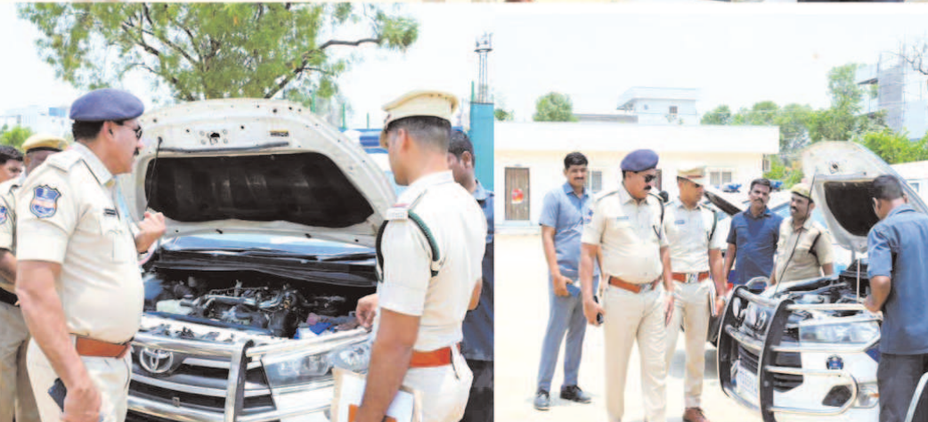
స్పష్టం చేశారు. ఈ కార్యక్రమంలో ఓటా, ఖీవి విజయ్ ఖాస్టర్, పోలీస్ వాహన డ్రైవర్లు మరియు ఇతర సిబ్బంది