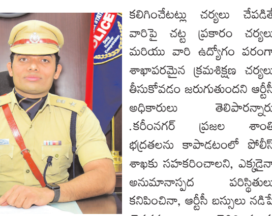
కలిగించేటట్లు చర్యలు చేపడితే వారిపై చట్ట ప్రకారం చర్యలు మరియు వారి ఉద్యోగం పరంగా శాఖాపరమైన క్రమశిక్షణ చర్యలు తీసుకోవడం జరుగుతుందని ఆర్మీకి అధికారులు తెలిపారు. కరీంనగర్ ప్రజల శాంతి భద్రతలను కాపాడటంలో పోలీస్ శాఖకు సహకరించాలని, ఎక్కడైనా అనుమానాస్పద పరిస్థితులు కనిపించినా, ఆర్మీకి బస్సులు నడిపే డ్రైవర్లను బెదిరింపులకు గురించేనా వెంటనే కరీంనగర్ పోలీస్ స్టేషన్ బ్రాంచి కంట్రోల్ రూమ్ నంబర్ 8712670713 కు కాల్ చేసి ద్వారా లేదా వాట్సాప్ ద్వారా సమాచారం అందించాలని సూచించారు. సమాచారం ఇచ్చిన వారి వివరాలను అత్యంత గోప్యంగా ఉంచుతామని ఆయన స్పష్టం చేశారు. సమాచారం అందించాలని పోలీస్ కమిషనర్ కోరారు.

ప్రాంతాలు, ముఖ్య కూడళ్లు, మరియు బస్టాండ్ పరిసరాల్లో అదనపు పోలీస్ బందోబస్తు ఏర్పాటు చేసినట్లు తెలిపారు. ఎవరైనా ఉద్దేశపూర్వకంగా అల్లర్లు సృష్టించేందుకు ప్రయత్నించినా, ప్రభుత్వ లేదా ప్రైవేట్ ఆస్తులకు నష్టం కలిగించినా, అధికారులపై దాడులకు పాల్పడినా, అలాంటి వారిపై కఠినంగా చట్టపరమైన చర్యలు తీసుకుంటామని హెచ్చరించారు. సోషల్ మీడియాలో తప్పుడు ప్రచారం, వదంతులు వ్యాప్తి చేసిన వారిపైనే పర్యవేక్షణ కొనసాగుతోందని, అలాంటి చర్యలకు పాల్పడిన వారిపై కూడా చట్టబద్ధ చర్యలు తీసుకుంటామని తెలిపారు. సమ్మెలో పాల్గొనే కార్మికులు మరియు ప్రజలు పరస్పర గౌరవం పాటించి, ఎలాంటి ఉద్రిక్తతలకు తావు లేకుండా వ్యవహరించాలని విజ్ఞప్తి చేశారు. శాంతి భద్రతల విఘాతం కలగకుండా సమ్మె నిర్వహించుకోవాలని ఎక్కడవైనా శాంతి భద్రతలకు విఘాతం