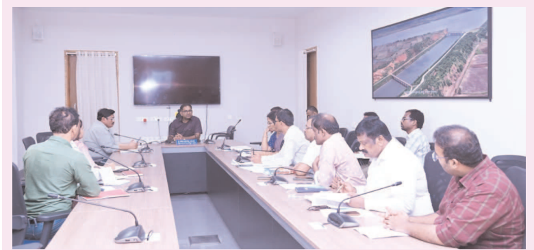
జిల్లా కలెక్టర్ కోయ శ్రీ హార్ష ఆయుష్ సేవలపై ప్రత్యేక దృష్టి -- యోగ కేంద్రాల ఏర్పాటు పరిశీలన. హెచ్ఎస్ఐ టీకా కార్యక్రమం వేగవంతం చేయాలి. గర్భిణీలకు ప్రత్యేక సంరక్షణ -- ప్రభుత్వ ఆసుపత్రుల్లో ప్రసవాల ప్రోత్సాహం. అగ్నిదారులను పెద్దపల్లి, ఏప్రిల్ 17: