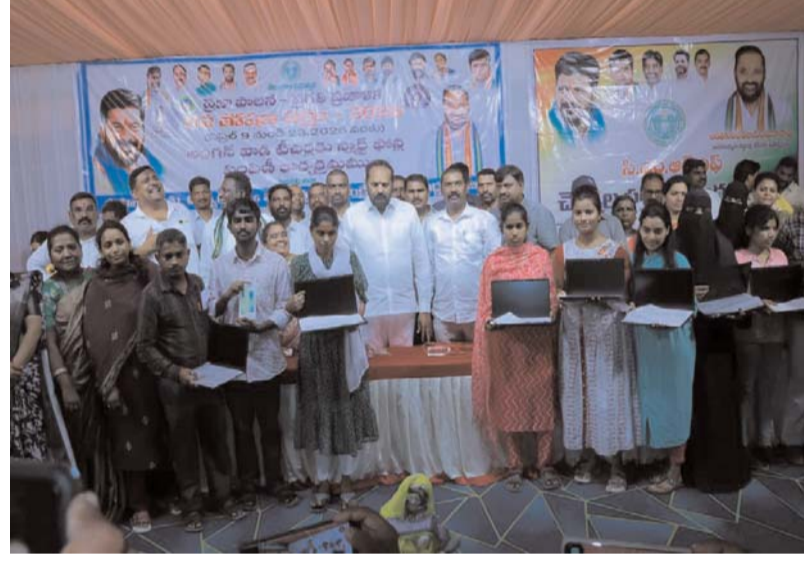
పేద ప్రజలకు ముఖ్యమంత్రి సహాయనిధి అనేది ఒక ఊరట..

అంగన్వాడీ టీచర్ల మెరుగైన సేవల కోసం స్టార్ షోస్ పంపిణీ..