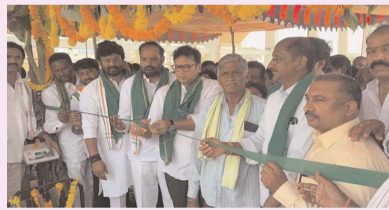
వరి ధాన్యం కొనుగోలు కేంద్రాల్లో ఎలాంటి ఇబ్బందులు లేకుండా కొనుగోళ్ళు చేపట్టాలని బడి, పరిశ్రమలు, శాసన సభ వ్యవహారాల శాఖ మంత్రి దుర్గి శ్రీధర్ బాబు