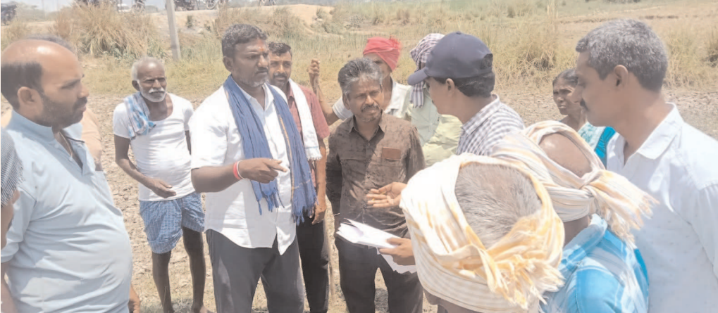
కార్యక్రమంలో పాల్గొన్న ఆర్ఐఐ, రెవెన్యూ సిబ్బంది, గ్రామ ఊట్ల శ్రీను కృతజ్ఞతలు తెలిపారు. పెద్దలు, నాయకులకు మంధని డివిజన్ దళిత నాయకుడు

ముత్తూరు మండలం పోతారం గ్రామంలో సర్వే నెంబర్ 59కు చెందిన భూములపై ప్రభుత్వ అధికారులు శుక్రవారం సర్వే నిర్వహించారు. ఈ భూములపై అక్రమ పట్టణాలు జరిగాయని, నిజమైన సాగుదారులకు హక్కులు కల్పించాలని గ్రామస్థులు అధికారులను కోరారు. గ్రామానికి చెందిన రైతులు, దళిత నాయకులు తెలిపిన వివరాల ప్రకారం, గత 80 ఏళ్లుగా తమ తాతల కాలం నుంచే ఈ భూములను సాగు చేసుకుంటూ జీవనం కొనసాగిస్తున్నామని పేర్కొన్నారు. అయితే కొందరు అపరిచితులు అక్రమంగా పట్టణాలు పొందడంతో ప్రభుత్వ సంక్షేమ పథకాల లబ్ధి పొందుతున్నారని ఆరోపించారు. ఈ విషయంపై ఇప్పటికే జిల్లా కలెక్టర్, మండల ఎమ్మార్వోలకు వివరాలను సమర్పించినట్లు తెలిపారు. ఈ నేపథ్యంలో అధికారులచే సర్వే నిర్వహించడాన్ని స్వాగతించి, నిజమైన సాగుదారులకు పట్టణాలు మంజూరు చేయాలని కోరారు. సర్వే