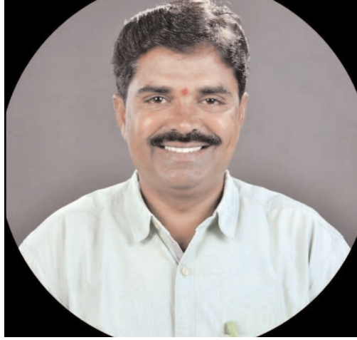
విలువను అంచనా వేయాలి. సంపద అనేది కేవలం సంపాదన కాదు; అది సమృద్ధి, భద్రత, స్థిరత్వం కలయిక. అవి ఉన్న చోటే నిజమైన ఆభివృద్ధి సాధ్యమవుతుంది.

పెట్టుబడుల విషయంలో అతి ఆక ప్రమాదకరం. తక్కువ సమయంలో ఎక్కువ లాభం పొందాలనే ఆలోచన చాలా సార్లు సవ్యాలకు దారితీస్తుంది. షేర్ మార్కెట్లో అనుభవం లేకుండా ప్రవేశించడం, గోల్డ్ లో నాణ్యతను నిర్ధారించకపోవడం--ఇవి ఆర్థిక స్థిరత్వాన్ని దెబ్బతీస్తాయి. అందుకే సేవ్టీ సేవింగ్స్, స్థిర పెట్టుబడులు ప్రజలకు మరింత రక్షణను అందిస్తాయి. కార్పొరేట్ షాపింగ్ సంస్థల్లో మరో అందోళనకర అంశం. మెరిసే లైట్లు, ఛార్జి అఫర్లు, ఆకర్షణీయమైన ప్రదర్శనలు--ఇవి కష్టమర్చును ఆకర్షించడానికి ఉపయోగించే సాధనాలు మాత్రమే. కానీ నాణ్యత, న్యాయమైన ధరలు అనేవి చాలా సార్లు ప్రశ్నార్థకంగా మారుతున్నాయి. ఇదే సమయంలో, చిన్న బడ్జెట్ షాపులు సమృద్ధిగా మూలధనంగా తీసుకుని ముందుకు సాగుతున్నాయి. ఆక్రమ హంగులు తక్కువైనా, నిజాయితీ ఎక్కువగా ఉంటుంది. కష్టమర్తతో ఉన్న సమృద్ధి వారి బలం. ఈ నేపథ్యంలో ప్రజలు తీసుకోవాల్సిన నిర్ణయం స్పష్టంగా ఉంది, మెరుపులకు లోనవకుండా, నిజాన్ని గుర్తించాలి. తక్షణ లాభాల కంటే, దీర్ఘకాల భద్రతను ఎంచుకోవాలి. ఆకర్షణల కంటే, ఆస్తి