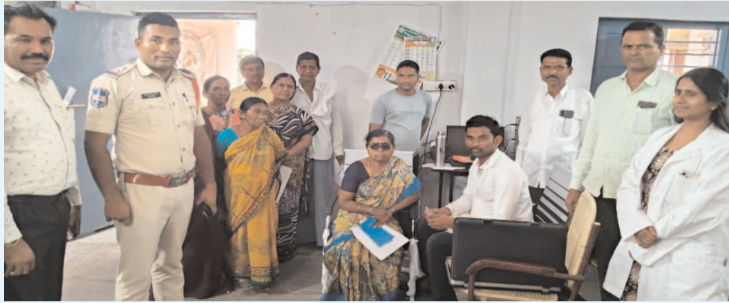
హెచ్చరించారు. అదేవిధంగా రోడ్డు భద్రత, ట్రాఫిక్ నియమాల పాటించు పై ప్రత్యేక అవగాహన కార్యక్రమం నిర్వహించి ప్రజలకు సురక్షిత ప్రయాణంపై సూచనలు అందించారు.

రోడ్డు భద్రతపై అవగాహన కార్యక్రమం నిర్వహణ ఆగ్నిధార స్టూన్స్, (పెద్దపల్లి): రోడ్డు భద్రతపై అవగాహన కల్పించే “అరైవ్ అరైవ్ ఫేజ్-03” కార్యక్రమంలో భాగంగా పెద్దపల్లి రూరల్ ఎస్టేట్ మల్టీప్లెక్స్ అధ్యక్షులతో మండలంలోని రాంపల్లి గ్రామంలో ఉచిత కంటి పరీక్ష శిబిరం నిర్వహించారు. ఈ శిబిరంలో డాక్టర్ అగర్వాల హాస్పిటల్ కు చెందిన వైద్య బృందం గ్రామానికి వచ్చి కంటి పరీక్షలు నిర్వహించింది. సుమారు 200 మంది గ్రామస్థులు ఈ శిబిరంలో పాల్గొని పరీక్షలు చేయించుకున్నారు. వీరిలో 20 మందికి ఉచితంగా కళ్లజోళ్లు పంపిణీ చేయగా, 5 మందిని కేటరాక్స్ శస్త్రచికిత్స కోసం రిఫర్ చేశారు. ఈ సందర్భంగా ఎస్టేట్ మల్టీప్లెక్స్ మాట్లాడుతూ, వాహనదారులు తప్పనిసరిగా ట్రాఫిక్ నియమాలను పాటించాలని సూచించారు. సీట్ బెల్ట్, హెల్మెట్ వినియోగం ద్వారా ప్రమాదాలను తగ్గించవచ్చని తెలిపారు. మద్దుడు సేవించి వాహనం సడపడం ప్రమాదకరమని