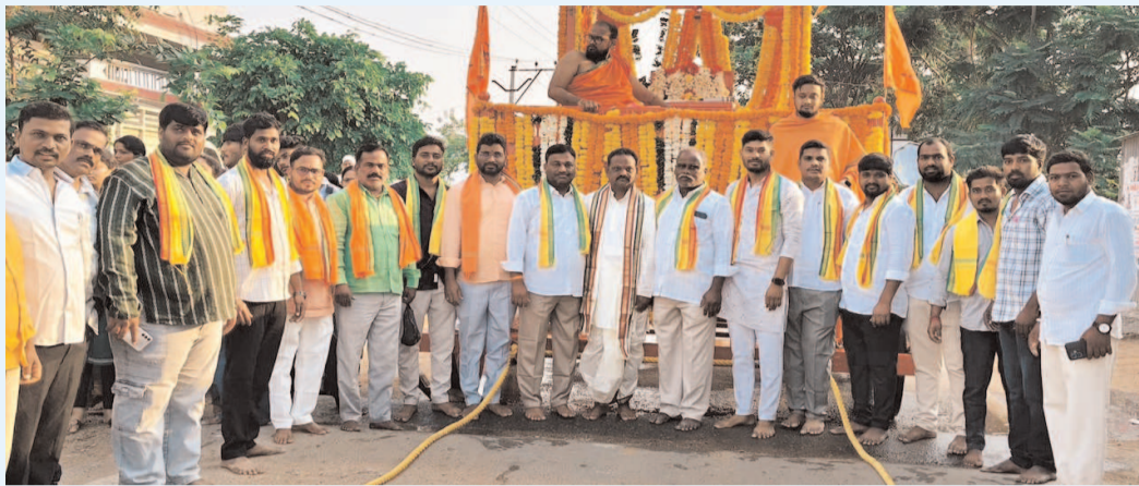
నిలిచాయి. మహిళలు రోడ్డు పోగునూ గోవింద లతో స్వామి వారిని దర్శించుకున్నారు. ఈ కార్యక్రమంలో నామస్మరణతో అడుగుడుగునా భక్తి శ్రద్ధలతో మంగళహారతులు గ్రామ ప్రజలు యువతీ యువకులు భక్తులు పాల్గొన్నారు.