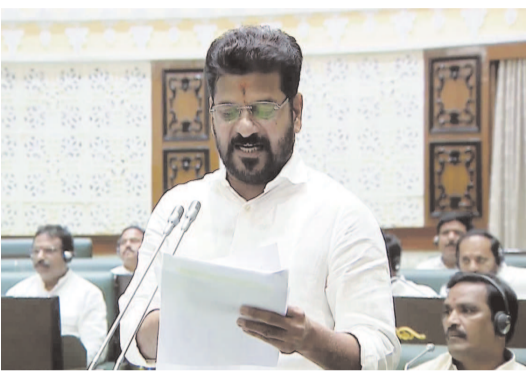
విధివిధానాలను, కార్యాచరణను ముందుకు తీసుకువెళ్లాలి అంటే ఫేజ్-1ను రాష్ట్ర ప్రభుత్వం స్వాధీనం చేసుకోవాలని సభ్యులను సభలో ప్రవేశపెట్టారు.

హైదరాబాద్ మెట్రోలను ప్రభుత్వం తీసుకునేందుకు ఉద్దేశించిన తీర్మానాన్ని శాసన సభ ఆమోదించింది. ఈ మేరకు ముఖ్యమంత్రి రేవంత్ రెడ్డి ప్రవేశపెట్టిన తీర్మానానికి సభ ఆమోదం తెలిపింది. హైదరాబాద్ మెట్రో విస్తరణకు ఉన్న అడ్డంకులు తొలగించేందుకు ప్రభుత్వం మెట్రోలైటు స్వాధీనం చేసుకోవాలనే నిర్ణయానికి వచ్చినట్లు తీర్మానం వెల్లడి చేసింది. ప్రజా ప్రయోజనాల దృష్ట్యా మెట్రో విస్తరణకు ప్రభుత్వం నిర్ణయం తీసుకుందని సీఎం రేవంత్ రెడ్డి తెలిపారు. మెట్రో విస్తరణకు ఉన్న అడ్డంకులపై సమీక్షించామని అన్నారు. ప్రస్తుతం 69 కి.మీ. మెట్రో నిర్మాణం జరిగిందని చెప్పారు. మెట్రో ఫేజ్-2వ కింద 76.4 కి.మీ, మెట్రో ఫేజ్-2బి కింద 86.1 కి.మీ మేర నిర్మాణం కోసం కేంద్రానికి ప్రతిపాదనలు పంపామని వెల్లడించారు. మెట్రో విస్తరణపై సీఎం ఆసెంబ్లీలో ప్రసంగించారు. “మెట్రో విస్తరణ జరగాలంటే కేంద్ర ప్రభుత్వం, రాష్ట్ర ప్రభుత్వం కలిసి విస్తరించాలి. విస్తరణకు అవసరమైన