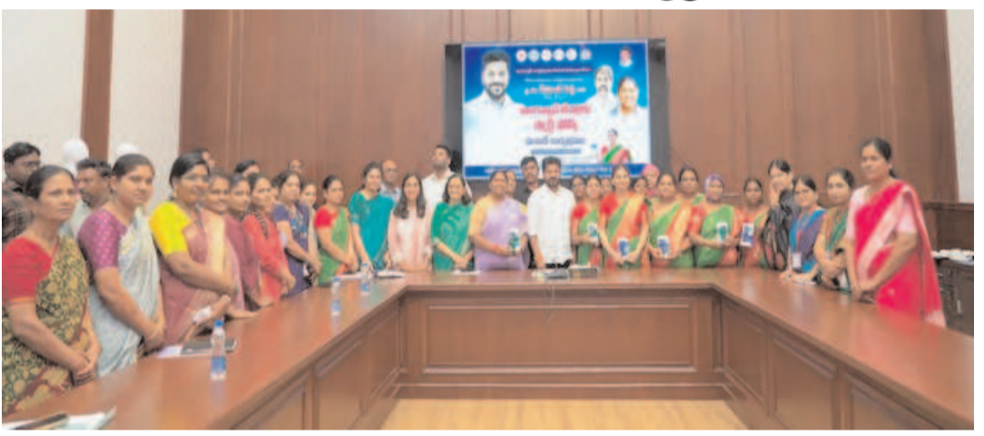
ఉండటానికి ఏర్పాటు, సొంత భవనాలు నిర్మించేందుకు అవసరమైన ప్రణాళికలు రూపొందించాలని అధికారులకు సీఎం స్పష్టం చేశారు. అరేబ్?వల్ల పిల్లలకు పోషకాహారం అందించే వారిలో మానసిక ఎదుగుదల ఉంటుందని, పోషకాహారం లేకపోవడం వల్లే ఎక్కువ సమస్యలు వస్తున్నాయని తెలిపారు. భవిష్యత్లో అవే అనారోగ్య సమస్యలకు దారి తీస్తున్నాయని అన్నారు. అలాంటి పరిస్థితులు రాకుండా ఉండేందుకే తెలంగాణ రాష్ట్ర ప్రభుత్వం ఇలాంటి పథకాలను ప్రవేశపెట్టినందుకు వివరించారు. “దేశంలో ప్రస్తుతం ఫుడ్ సెక్యూరిటీ ఉంది. కానీ