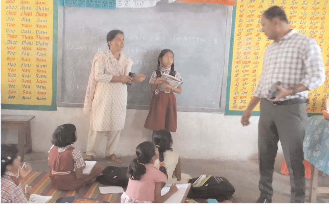
కల్చురల్ పట్టణంలోని ప్రాథమిక పాఠశాల హనుమాన్ చేసే విద్యార్థుల హాజరు ఉపాధ్యాయుల హాజరు విద్యార్థుల నగర్, ప్రాథమిక పాఠశాల హరిజన్ వాడీ పాఠశాలను తనిఖీ ప్రమాణాలను పరిశీలించారు.