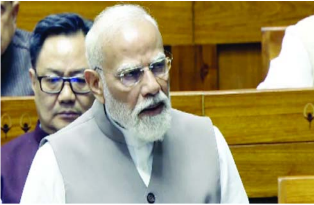
అంతేకాకుండా దేశీయ ఉత్పత్తిని కూడా పెంచుతున్నామని వెల్లడించారు.

పశ్చిమాసియాలో కొనసాగుతున్న యుద్ధ పరిస్థితులు ప్రపంచవ్యాప్తంగా ఆందోళన కలిగిస్తున్నాయని ప్రధానమంత్రి నరేంద్ర మోదీ పేర్కొన్నారు. ఆ సంక్షోభం ప్రపంచ ఆర్థిక వ్యవస్థపై మాత్రమే కాకుండా ప్రజల జీవన విధానంపై కూడా తీవ్ర ప్రభావం చూపుతోందని ఆయన అన్నారు. సోమవారం లోక్సభలో ఆ అంశంపై మాట్లాడిన ప్రధాని, పరిస్థితులు ఆందోళనకరంగా ఉన్నాయని స్పష్టం చేశారు. అమెరికా-ఇజ్రాయెల్-ఇరాన్ మధ్య ఉద్రిక్తతలు కొనసాగుతున్న నేపథ్యంలో ఆ యుద్ధం నాలుగో వారంలోకి ప్రవేశించింది. దీని ప్రభావం భారత్పై కూడా పలు రంగాల్లో కనిపిస్తుందని మోదీ చెప్పారు. ముఖ్యంగా ఆర్థిక, భద్రతా, మానవతా కోణాల్లో సహజ ఎదురవుతున్నాయని వివరించారు. భారత్కు అవసరమైన ముడి చమురు, సహజ వాయువు (గ్యాస్)లో పెద్ద భాగం పశ్చిమాసియా దేశాల నుంచే వస్తుంది ప్రధాని గుర్తు చేశారు. ఆ ప్రాంతం ఇతర దేశాలతో వాణిజ్యానికి కీలక మార్గంగా కూడా పనిచేస్తుందని చెప్పారు. అందువల్ల అక్కడే పరిస్థితులు దిగుమతులు, ఎగుమతులు, సముద్ర మార్గ రవాణాపై ప్రభావం చూపుతున్నాయని వివరించారు. హర్యాణ్ జలసంధి ద్వారా భారత్కు భారీ స్టాయిలో చమురు, గ్యాస్, ఎరువులు వంటి కీలక వస్తువులు రవాణా అవుతున్నాయని తెలిపారు. అయితే యుద్ధ పరిస్థితుల వల్ల ఆ మార్గంలో నౌకల రాకపోకలు కష్టతరంగా మారాయని అన్నారు. అయినప్పటికీ కేంద్ర ప్రభుత్వం ముందస్తు చర్యలు తీసుకుని పెట్రోల్, డీజిల్, గ్యాస్ సరఫరా అంతరాయం కలగకుండా చూసినందుకు మోదీ స్పష్టం చేశారు. దేశంలో ఎలీవీజీ వినియోగం ఎక్కువగా దిగుమతులపై ఆధారపడి ఉందని ఆయన తెలిపారు. సుమారు 60 శాతం ఎలీవీజీ అవసరాలు దిగుమతుల ద్వారానే నెరవేరుతున్నాయని చెప్పారు. ప్రస్తుత పరిస్థితుల్లో దేశీయ వినియోగదారులకు ప్రాధాన్యం ఇచ్చేలా చర్యలు తీసుకుంటున్నామని,