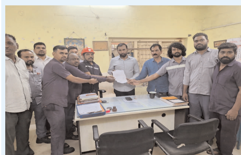
జిడికే 11వ ఇంకవై గని మేనేజర్ కు ఏబిఐయూసి వినతి ఆగ్ని ధార న్యూస్, (రామగుండం):