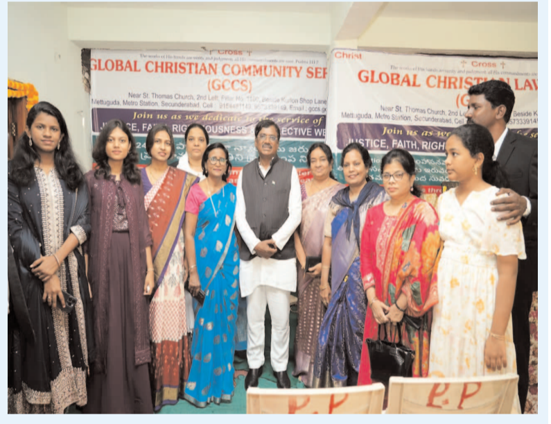
మంత్రి వివేక్ వెంకటస్వామి

అగ్ని ధార స్టూన్స్, (హైదరాబాద్): హైదరాబాద్ నగరంలో క్రిస్టియన్ భవన్ నిర్మాణానికి అవసరమైన చర్యలు తీసుకుంటున్న రాష్ట్ర కార్మికుల, ఉపాధి మరియు గమల శాఖ మంత్రి జి. వివేక్ వెంకటస్వామి తెలిపారు. ఈ విషయాన్ని ముఖ్యమంత్రి ఎ. రేవంత్ రెడ్డి దృష్టికి తీసుకెళ్లి ప్రభుత్వ అనుమతి తీసుకోవ్వేలా కృషి చేస్తామని పేర్కొన్నారు. సోమవారం మెట్టూరుగూడలో గ్లోబల్ క్రిస్టియన్ లా బోర్డ్ కార్యాయాన్ని మంత్రి వివేక్ వెంకటస్వామి ప్రారంభించారు. ఈ సందర్భంగా మాట్లాడుతూ గ్లోబల్ క్రిస్టియన్ లా బోర్డ్ స్థాపన మంచి పరిణామమని అన్నారు. క్రైస్తవ సమాజం ఎదుర్కొంటున్న సమస్యల పరిష్కారానికి ఈ బోర్డ్ సమర్థవంతంగా పని చేస్తుందని ఆశాభావం వ్యక్తం చేశారు. పేద మరియు అవసరమైన క్రైస్తవులకు సేవ చేయాలనే ఉద్దేశంతో ఈ బోర్డ్ ఏర్పాటు చేయడం అభినందనీయమని తెలిపారు. ముఖ్యంగా క్రైస్తవులకు అవసరమైన లీగల్ సహాయం అందించడంలో ఈ లా బోర్డ్ కీలక పాత్ర పోషిస్తుందని పేర్కొన్నారు. క్రైస్తవ మైనారిటీ సంక్షేమంలో మహిళల అభివృద్ధి కూడా ముఖ్యమని మంత్రి చెప్పారు. ప్రభుత్వం అమలు చేస్తున్న సంక్షేమ పథకాలను క్రైస్తవ మహిళలు విస్తృతంగా వినియోగించుకోవాలని సూచించారు.