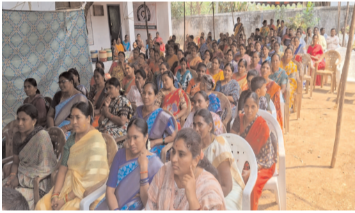
తమ ప్రాణాలను కాపాడుకోవాలని సూచించారు. గ్రామంలో మద్దతును నిషేధం అమలు చేయాలని, బెల్ట్ షాపులు నిర్వహించకూడదని, ప్లాస్టిక్ వినయోగం తగ్గించాలని ఏకగ్రీవంగా తీర్మానం చేశారు. గ్రామ అభివృద్ధి ఆరోగ్యకరమైన వాతావరణం కోసం తీసుకున్న ఈ నిర్ణయాన్ని పోలీసులు