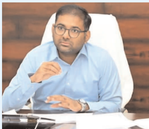
కంట్రోల్ సెల్ లను పెద్దపల్లి జిల్లాకు ప్రభుత్వం కేటాయింది అన్నారు. వ్యవసాయేతర పథకాలకు 21

అగ్నిధారస్మాన్ పెద్దపల్లి, మార్చి 16:- మార్చి 24 లోపు యువతీ యువకులు, వార్షిక ప్రణాళిక దరఖాస్తులు సమర్పించాలని జిల్లా కలెక్టర్ కోయ శ్రీ హర్ష సోమవారం ఒక ప్రకటనలో తెలిపారు. తెలంగాణ రాష్ట్రంలో నిరుద్యోగ ఎస్సీ యువతీ యువకులకు స్వయం ఉపాధి అవకాశాలు కల్పించేందుకు ప్రభుత్వం పలు పథకాలను ఆమోదించింది అన్నారు. 2025-26 వార్షిక ప్రణాళికకు సంబంధించి 90 శాతం సబ్సిడీ 10 శాతం బ్యాంకు లోన్ తో లక్ష రూపాయల విలువ గల 100 టూ వీల్ ఎలక్ట్రిక్ వాహనాలు, 70 శాతం సబ్సిడీ, 30 శాతం బ్యాంకు లోన్ తో 3 లక్షల రూపాయల విలువ గల 71 శ్రీ వీల్ ఎలక్ట్రిక్ వాహనాలు, 7 లక్షల రూపాయల విలువ గల 15 సోలార్ యూనిట్ల వంపు