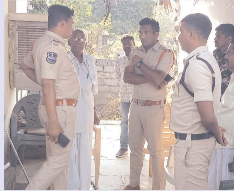
అగ్నిధారస్వాస్ పెద్దపల్లి రైస్