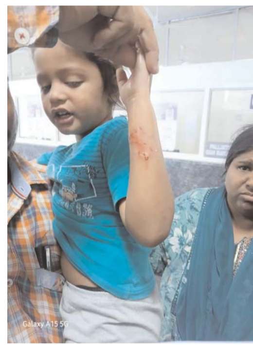
ప్రజలు డిమాండ్: వెంటనే కాలనీలో దాగ్ మెనేజ్ మెంట్ డ్రైవ్, బాధితులకు తక్షణ వరిహారం, భవిష్యత్తులో ఇలాంటి ఘటనలు జరగకుండా నిరోధక చర్యలు, చేపట్టాలని ప్రజలు కాలనీ వాసులు డిమాండ్ చేస్తున్నారు.