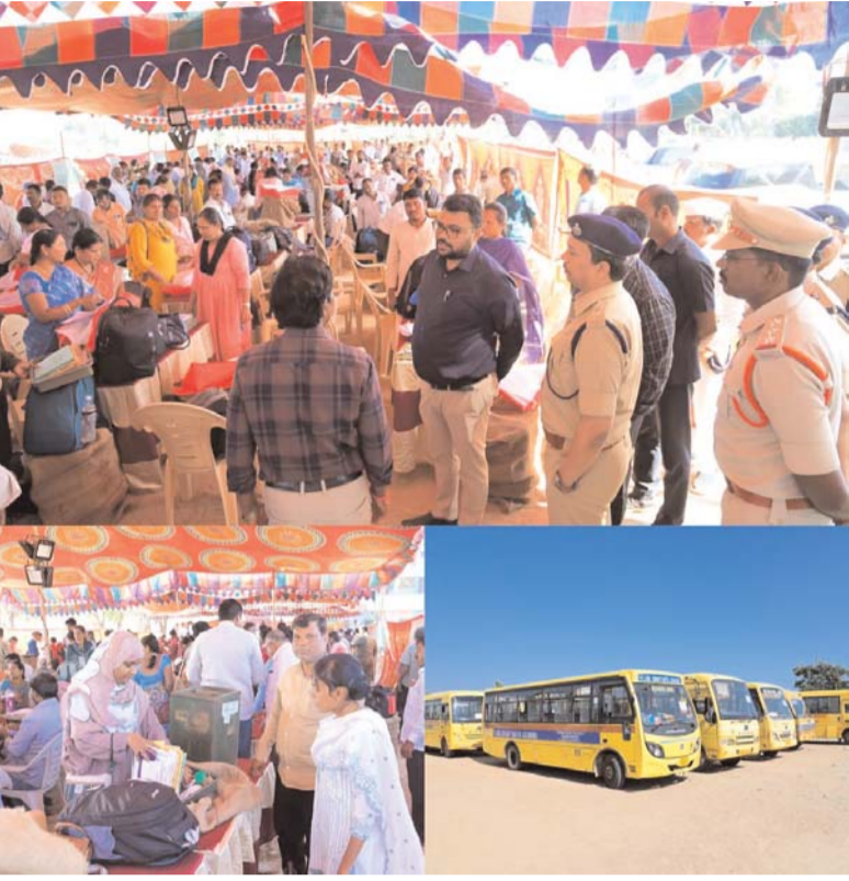
తెలియజేయాలని అధికారులను ఆదేశించారు. డిస్ట్రిబ్యూషన్ కేంద్రాలలో అందుబాటులో ఉన్న సదుపాయాలను పరిశీలించి సంతృప్తి వ్యక్తం చేశారు.

పంపిణీ సమయంలో ప్రతి పోలింగ్ బృందానికి అవసరమైన సామగ్రి సమయానికి అందించేందుకు ప్రత్యేక డెస్కులను కలెక్టర్ పర్యవేక్షించారు. బృందాలు వచ్చిన క్రమానుసారం రిజిస్ట్రేషన్ నుంచి మెటీరియల్ పంపిణీ వరకూ మార్గదర్శకాలు పాటించాలన్నారు. ఎక్కడ అలసత్వం, అయోమయం తలెత్తకుండా తగిన సూచిక బోర్డులు, సహాయక కేంద్రాలు ఏర్పాటు సరి చూసుకోవాలని సూచించారు. అదేవిధంగా భద్రత, సీసీ కెమెరా పర్యవేక్షణ, పోలింగ్ సిబ్బందికి త్రాగునీరు, విశ్రాంతి గదులు, వైద్య అత్యవసర సదుపాయాల లభ్యతపై అడిగి తెలుసుకున్నారు. పోలింగ్ సామగ్రి, ముఖ్యంగా బ్యాటల్ పత్రాలను సమయంలో తప్పనిసరిగా సాయుధ పోలీసులతో బందోబస్తు కల్పించాలని కలెక్టర్ స్పష్టం చేశారు. డిస్ట్రిబ్యూషన్ కేంద్రాల త్రాగునీరు, లైటింగ్, పార్కింగ్, మార్గ సౌకర్యాలు సమగ్రంగా ఉండేలా చూడాలని, ఎవైనా లోపాలు కనిపించిన వెంటనే