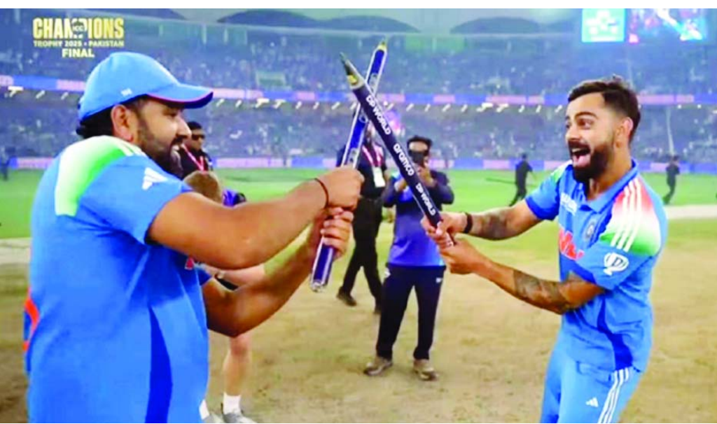
హర్యానా రాష్ట్రాల నుంచి 38 శాతం మేర ప్యూస్ వచ్చినట్లు సమాచారం. ఇక వైపై సాయంతో మ్యూజిక్ వీక్షించిన రాష్ట్రాల్లో మహారాష్ట్ర ముందు ఉంది. కాగా 16 మార్చిమాల్లో ఛాంపియన్స్ ట్రోఫీని ప్రసారం చేశారు. తొమ్మిది భాషల్లో కామెంట్ రీ ఆచ్చారు.

ఇటీవల ముగిసిన ఛాంపియన్స్ ట్రోఫీ పూయర్ షిఫ్ట్ నకు సంబంధించిన వివరాలు ఐసీసీ విడుదల చేసింది. ఈ టోర్నమెంట్ కు 540.3 కోట్లకు పైగా ప్యూస్ వచ్చినట్లు... వాచ్ లైమ్ ఏకంగా 11వేల కోట్ల నిమిషాలకు పైగా నమోదయినట్లు వెల్లడించింది. అంతేకాదు.. ఓవరాల్ గా 6.2 కోట్ల మంది ప్యూయర్స్ ఈ మెగా ఈవెంట్ ను వీక్షించినట్లు ట్రాన్స్ కాస్టర్ వెల్లడించింది. కాగా పాకిస్తాన్ లో 1996 తర్వాత ఓ ఐసీసీ టోర్నీ జరగడం ఇదే తొలిసారి. ఇక ఫిబ్రవరి 19న పాకిస్తాన్ లో మొదలైన ఈ వన్డే ఈవెంట్ మార్చి 9న భారత్-స్వాజిలాండ్ మధ్య దుబాయి వేదికగా పైన్ లోతో ముగిసింది. 2025 ఛాంపియన్స్ ట్రోఫీని కోల్కాతా మంది వీక్షించడంలో ఆశ్చర్యమేమీ లేకపోయినా.. చరిత్రలో ఎన్నడూ లేని విధంగా ఏకంగా 540 కోట్లకు పైగా ప్యూస్ రావడం ఇదే తొలిసారి. స్టార్ స్ట్రోమ్, స్ట్రోమ్, 18 నెట్ వర్క్ లో టీవీలో ప్రసారాలు జరుగగా.. జియో హాట్ స్టార్ లోనూ ప్రత్యక్ష ప్రసారం చేశారు. కాగా మిగతా మ్యూజిక్ పోలిస్ టీమిండియా-స్వాజిలాండ్ మధ్య పైన్ లోతో అత్యధిక ప్యూస్ వచ్చినట్లు తెలుస్తోంది. ఈ టైటిల్ పోరుకు ఏకంగా 124.2 కోట్ల వీక్షణలు వచ్చాయి. కాగా మొత్తంగా ఛాంపియన్స్ ట్రోఫీకి వచ్చిన ప్యూయర్ షిఫ్ట్ ఉత్తరప్రదేశ్, ఉత్తరాఖండ్, మహారాష్ట్ర, గోవా, పంజాబ్,