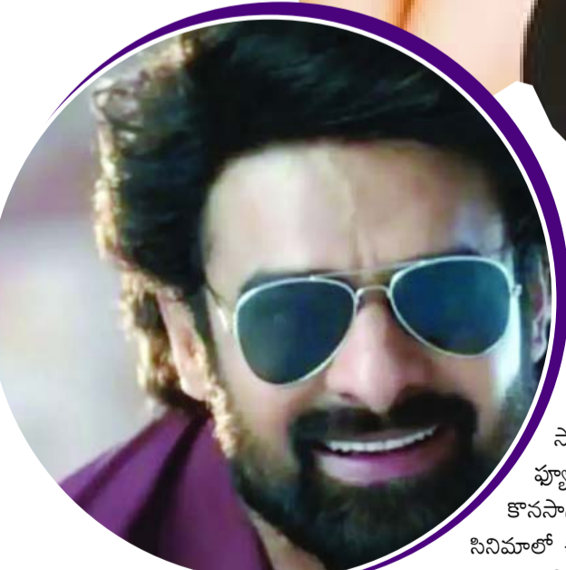
అనుకున్నారు కానీ కుదరలేదు. ప్రభాస్ రాజా సాబ్ రిలీజ్ కన్ ఫ్యూజన్ కొనసాగుతూనే ఉంది. సినిమాలో చాలా సర్ ప్రైజ్ లు ఉన్నాయని మేకర్స్

రెబల్ స్టార్ ప్రభాస్ మారుతి కాంటినెంట్ లో వస్తున్న సినిమా రాజా సాబ్. పీపుల్ మీడియా ఫ్యాక్టరీ నిర్మిస్తున్న ఈ సినిమాలో మాళవికా మోహనన్, నిధి అగర్వాల్ హీరోయిన్ గా నటిస్తున్నారు. ఈ సినిమాకు ధమన్ మ్యూజిక్ అందిస్తున్నారు. డ్రిల్లర్ జోసర్ లో వస్తున్న ఈ సినిమా విషయంలో మేకర్స్ ప్లానింగ్ అంతా ఒక రేంజ్ లో ఉంది. ఐతే స్టార్ సినిమాల్లో డ్రిల్లర్ జోసర్ సినిమాలు చాలా అరుదు. అందులోనూ ప్రభాస్ లాంటి స్టార్ తో ఇలాంటి అటెండ్ నెవర్ బిఫోర్ అని చెప్పొచ్చు. ఇప్పటివరకు రాజా సాబ్ సినిమా నుంచి కేవలం ప్రభాస్ ఎంట్రి తో పాటు మోషన్ పోస్టర్ మాత్రమే వచ్చాయి. సినిమా నుంచి టీజర్ కోసం ఫ్యాన్స్ ఎంతగానో ఎదురుచూస్తున్నారు. ఐతే రాజా సాబ్ సినిమా నుంచి లేటెస్ట్ గా వస్తున్న టాక్ ఎంటంటే ఇది ఆడియన్స్ కు ఒక రేర్ ఎక్స్ పీరియన్స్ అందిస్తుందని అంటున్నారు. రెగ్యులర్ డ్రిల్లర్ కథలు, సినిమాలకు భిన్నంగా ఈ సినిమా నెక్స్ లెవెల్ లో ఉండబోతుందని తెలుస్తుంది. డ్రిల్లర్ సినిమా అనగానే భయ పెట్టడం నవ్వించడం ఉంటాయి ఐతే ఈ సినిమాలో ఆ రెండింటితో పాటు ఆడియన్స్ కు ఒక కొత్త ఎక్స్ పీరియన్స్ కూడా ఫీల్ అయ్యే ఛాన్స్ ఉంటుందట. పాన్ ఇండియాలో భారీ క్రేజ్ ఉన్న ప్రభాస్ ఇలాంటి కథను ఎంపిక చేసుకోవడమే పెద్ద సాహసం అనిపించేలా ఈ సినిమా ఉంటుందని తెలుస్తుంది. సినిమాను అసలైతే ఈ సమ్మర్ కి తీసుకు రావాలని