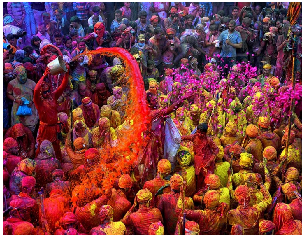
ఉపశమనానికి కొన్ని ఔషధ మొక్కల నుంచి తయారు చేసిన సహజమైన రంగులు కలిపిన, నీటిని చల్లుకోవడం వల్ల ఈ వ్యాధుల వ్యాప్తి తగ్గుతుందని పెద్దలు చెప్పేవారు. పూర్వకాలంలో మారుపు పుష్పాలు తెచ్చి రోట్లో పోసి దంచి, నీళ్ళతో కలిపి చల్లుకునే వారని జానపద పాటల ద్వారా గ్రహించ వీలగు తున్నది. మోదుగు పుష్పను దంచి శీతల కషాయం చేసి, చల్లు కోవడం వైద్య ప్రక్రియలో భాగమై, ఆరోగ్య పర్యక్త మవుతుంది. మోదుగును సంస్కృతంలో 'పలాశ' అంటారు. బ్రహ్మచర్య ప్రత దీక్షితుడైన ఉపవేతుడైన పలునిగి రెండధారణ, పలాశ పుష్ప కాయలో ఉపయోగం కార్యకలా పం, పలాశ పత్రాలతో కుట్టిన విస్తర్ణ భోజనం ఆవరణగా ఉంది. వసంత కాలంలో ఎటువంటి వారికైనా కామోద్దివసం