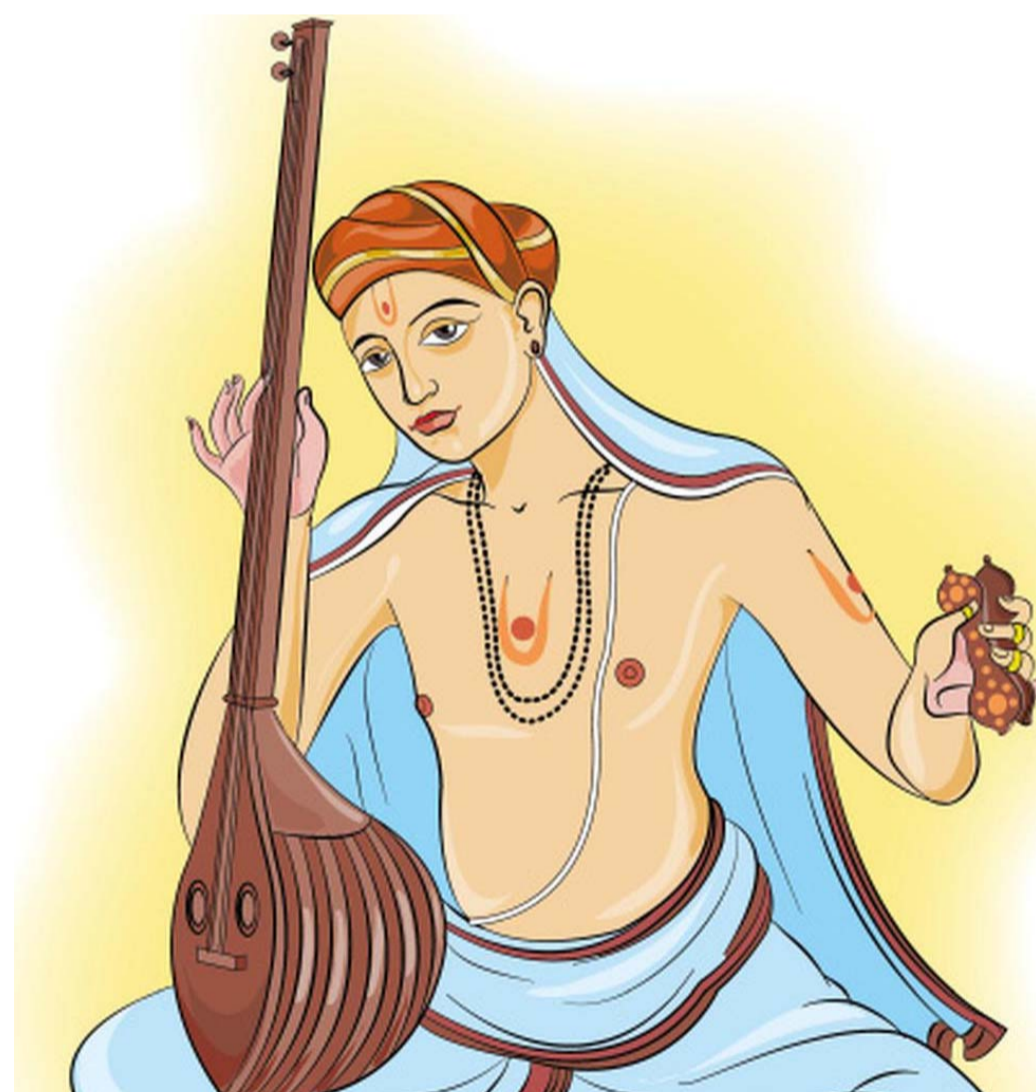
అన్నట్లు 96 కోట్ల సార్లు రామ నామాన్ని జపించి, స్వీయూనుభవ భావనలలో కృతి రూపంలో మలచి గాంధర్వ గాన మధురానుభూతిగా లోకానికి అందించారు. భూలోక నారదమైన త్యాగరాజు స్వామికి, దేవ ఋషి అయిన "నారదమే" స్వయంగా సంగీతంలోని రహస్యాలను చెప్పి, "స్వరార్ణవము" ఇచ్చినట్లు, ఆ నందర్భంలోనే "సాధించెనే మనసా" అనే పంచ రత్న మాలిక లోని మూడవ కృతి చేసినట్లు ప్రాచుర్యంలో ఉన్నది. నారద అనుగ్రహ ఫలితంగానే అనేక విషయాలు గ్రహించి, 24వేల రచనలు, 800కీర్తనలు గావించాడు. మంత్రోపదేశం తో "స్వరార్ణవం, నారదీయం" అనే రెండు సంగీత రహస్యార్థ శాస్త్ర గ్రంథ రచనలు గావించారు. త్యాగయ్య కృతులను ప్రాపంచికం, తాత్వికం, కీర్తనం, నిత్యానుష్ఠానం, అని నాలుగు విధాలుగా గుర్తించారు. చాలావరకు తెలుగులో రచనలు చేసినా, అవి తెలుగు నాట కన్నా, తమిళ నాట ఎక్కువ ప్రాచుర్యం పొందాయి. జగదానంద కారకా అనే కీర్తన శ్రీరాముని 109 నామాలును ఉటంకిస్తుంది. "జగదానంద కారకా (నాట), దురుకు గల (గాళ), సాధించినే (అరబ్డి), ఎందరో మహాను భావులు (శ్రీ), కన కన రుద్రీ (వూళ్ళో)", అనేవి పంచ రత్న మాలికగా "త్యాగరాజు ఆరాధనోత్సవాలలో" ప్రారంభం కీర్తనలుగా గానం చేయ బడతాయి. త్యాగరాజు స్వామి పరమపదించిన దినమైన, పుష్ప కృష్ణ పక్ష పంచమి నాడు, శ్రీ త్యాగరాజు ఆరాధనోత్సవాలు కార్యక్రమాలు నిర్వహిస్తారు. ప్రధానంగా