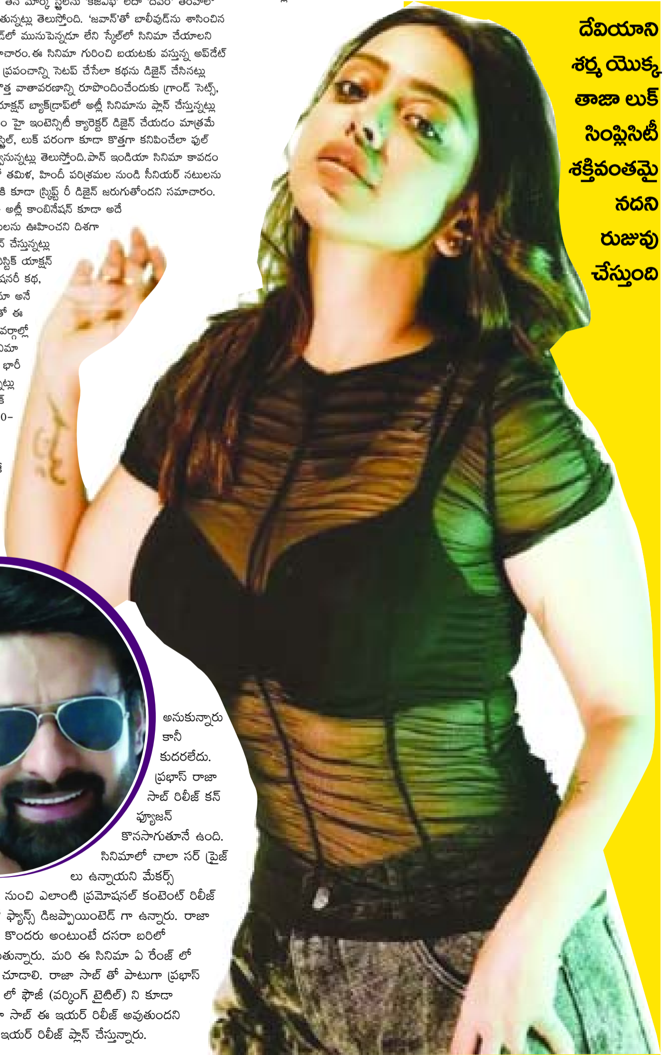
దేవియాని శర్మ యొక్క తాజా లుక్ సింప్లిసిటీ శక్తివంతమైనదని రుజువు చేస్తుంది

వసూళ్లు సాధించే స్థాయికి వెళ్లింది. దీంతో, ఈ సినిమా తర్వాత ఇంకో మెట్టు పైకి వెళ్లేలా బన్నీ ప్లాన్ చేస్తున్నారు. ఈ లెవెల్ లో సినిమాకు హైట్ క్రియేట్ చేయాలంటే, కేవలం స్టోరీ, యాక్షన్ మాత్రమే కాకుండా, అట్లీ ప్రత్యేకమైన మాన్ కమర్షియల్ డ్రీమింగ్ కూడా ఉండాలి. మరి అట్లీ ప్లానింగ్ ఏ లెవెల్ లో ఉంటుందో చూడాలి.