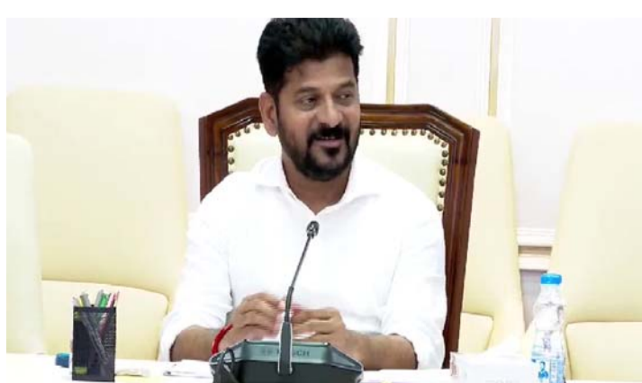
ప్రతినిధులకు సూచించారు. మీడియాతో ఇష్టాగోష్ఠిగా మాట్లాడిన సీఎం రేవంత్ రెడ్డి అనేక అంశాలను మీడియాతో పంచుకున్నారు. అభివృద్ధిని అన్ని ప్రాంతాలకు విస్తరించాలి : బడ్జెట్ లో ప్రాజెక్టులకు కేటాయించే నిధులు పరిమితంగానే ఉంటాయన్న సీఎం రేవంత్ రెడ్డి కేంద్రం నుంచి నిధులు ఇవ్వాలని కోరుతున్నట్లు వెల్లడించారు. త్రిబుల్ ఆర్ ప్రాజెక్టుకు నిధులు ఇస్తామని గతంలో మోడీ హామీ ఇచ్చినందునే తాము అడుగుతున్నామని స్పష్టం చేశారు. మెట్రో తానే తెచ్చానన్న కిషన్ రెడ్డి చెబుతున్నందునే తాము నిధులు తీసుకురమ్మని కోరుతున్నట్లు వివరించారు. జాతీయ రహదారులకు అవసరమైన భూసేకరణకు అడ్డు పడుతున్నది ఈటెల రాజేంద్రనేకదా అని ఎదురు ప్రశ్నించారు. - వివరాలు 2 లో