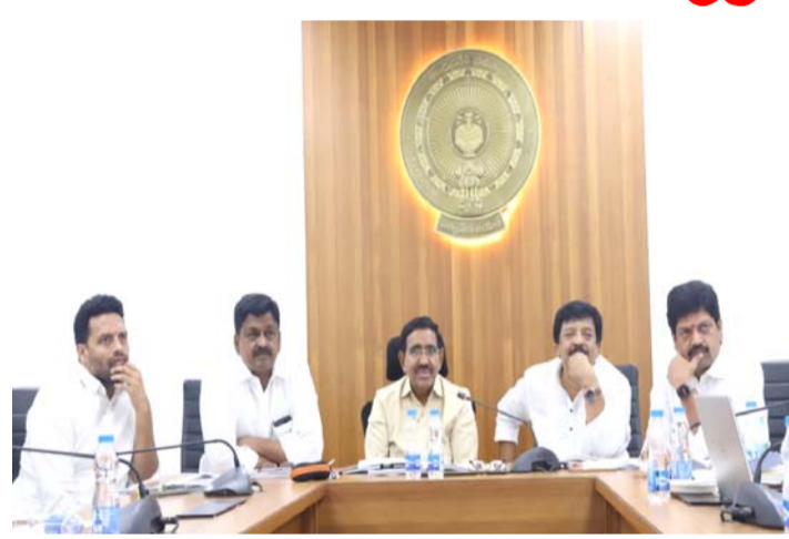
మద్యంగా చర్చించింది. అనంతరం కీలక నిర్ణయం తీసుకుంది. రాజధాని ప్రాంతంలో గతంలో 131 సంస్థలకు భూములు కేటాయించామని మంత్రి తెలిపారు. మొత్తం 44 సంస్థలకు 2014-19 సమయంలో భూములు కేటాయించినట్లు తెలిపింది. అయితే వీటిలో 31 సంస్థలకు వివరాలు 2 లో