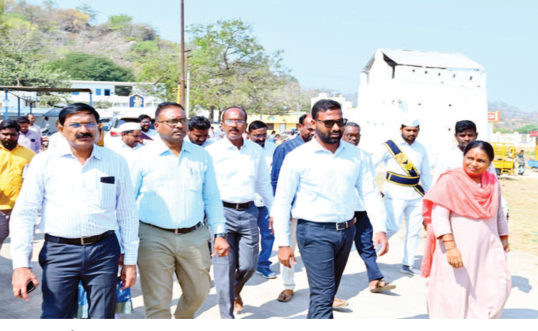
జాతరకు వచ్చే భక్తులకు ఎటువంటి ఇబ్బందులు కలుగకుండా ఏర్పాట్లు చేయాలి

అలయ పరిసరాలను ఎప్పటికప్పుడు శానిటైజ్ చేయాలి జిల్లా కలెక్టర్ బి. సత్య ప్రసాద్