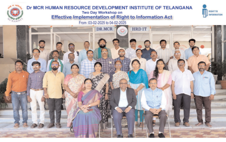
Dr MCR HUMAN RESOURCE DEVELOPMENT INSTITUTE OF TELANGANA Two Day Workshop on Effective Implementation of Right to Information Act

కూడా ఇవ్వడం లేదని పొట్టెన్న వక్రలు ఈ సందర్భంగా తమ అభిప్రాయాలను వెలిబుచ్చారు.