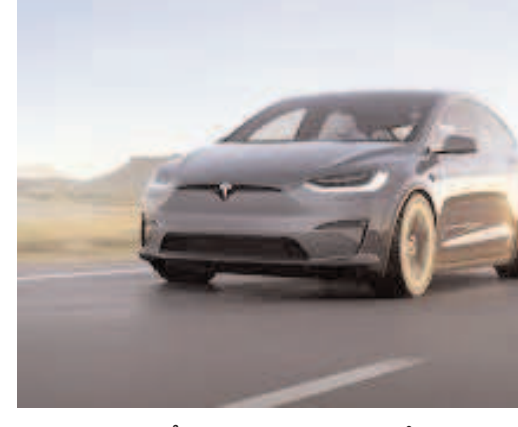
అత్యధునిక డిజైన్, ఫీచర్ల కారణంగా అమెరికాలో ప్రజాదరణ పొందింది. దాంతో పాటు అక్కడి ప్రభుత్వం అందజేస్తున్న ప్రోత్సాహకాలు, విస్తృతమైన సూపర్ చార్జర్ నెట్వర్క్ ల కారణంగా టెస్లా కార్లు కొనుగోలుదారులను ఆకర్షించాయి. కంపెనీ యజమాని అయిన ఎలోన్ మస్క్ తరచూ సోషల్ మీడియా ద్వారా టెస్లా కంపెనీ కార్ల గురించి ఇన్ఫర్మేషన్ ఇస్తూనే ఉంటారు. దీంతో జనాల్లో ఎప్పుడూ ఈ కారు గురించిన చర్చలు నడుస్తూనే ఉంటాయి.వాస్తానికి కొన్నేళ్లుగా భారత్ మార్కెట్లో తమ వాహనాలను అమ్మాలని టెస్లా చూస్తుంది. ఎట్టకేలకు కంపెనీ నిరీక్షణకు తెరపడింది. ఈ నేపథ్యంలోనే ఏప్రిల్ నుంచి దేశంలో టెస్లా కార్లు అందుబాటులోకి రాబోతున్నాయి. అయితే.. ప్రస్తుతానికి దేశీయంగా ఉత్పత్తి ప్లాంట్లను నిర్మించడం, ఇక్కడే ఉపాధి అవకాశాలను పెంచడం వంటి కండ్డెషన్లను పక్కనపెట్టి..

స్పాట్లీ : దేశంలోని రెండు ప్రధాన నగరాల్లో ఇప్పటికే రిటైల్ అవుట్ లెట్ల కోసం స్టలాన్ని లీజుకు తీసుకున్న టెస్లా.. అక్కడి నుంచి అమ్మకాలను జరుపనుంది. ఏప్రిల్ నెలలో టెస్లా కంపెనీ భారత్ లో తన మె?దటి షోరూమ్ ప్రారంభించనున్నట్లు తెలుస్తోంది. అప్పుడే దాని తొలి ఎలక్ట్రిక్ కారు భారత్ లోకి రానున్నట్లు సమాచారం. అసలు టెస్లా కారు అమెరికాలో ఎందుకు ఇంత ఫేమస్ అయిందో చూద్దాం.భారత ప్రధాని మోడీ అమెరికా పర్యటనకు వెళ్లి వచ్చారు. ఆ సమయంలో ఆయన అమెరికా అధ్యక్షుడు డోనాల్డ్ ట్రంప్, ప్రపంచ కుబేరుడు ఎలాన్ మస్క్ లతో భేటీ అయ్యారు. దీంతో భారత్ లోకి టెస్లా ఎంట్రి ఖాయం అయినట్లు తెలుస్తోంది. ఇప్పటికే దేశంలోని వివిధ విభాగాల్లో ఆ కంపెనీలో పని చేసేందుకు ఉద్యోగుల కోసం టెస్లా ఆన్లైన్ మొదలు పెట్టింది. అందుకు ఉద్యోగ ప్రకటనలను కూడా చేసింది. ప్రస్తుతం టెస్లా ఎప్పుడెప్పుడు భారత్ లోకి అడుగు పెడుతుందా అని చాలా మంది ఆతృతగా ఎదురుచూస్తున్నారు. ఈ నేపథ్యంలోనే ఏప్రిల్ నెల నుంచి కార్ల ప్రయోగం టెస్లా కార్లు అందుబాటులో ఉంటాయని ఆకర్షించాయి. కంపెనీ యజమాని అయిన ఎలోన్ మస్క్ తరచూ సోషల్ మీడియా ద్వారా టెస్లా కంపెనీ కార్ల గురించి ఇన్ఫర్మేషన్ ఇస్తూనే ఉంటారు. దీంతో జనాల్లో ఎప్పుడూ ఈ కారు గురించిన చర్చలు నడుస్తూనే ఉంటాయి.వాస్తానికి కొన్నేళ్లుగా భారత్ మార్కెట్లో తమ వాహనాలను అమ్మాలని టెస్లా చూస్తుంది. ఎట్టకేలకు కంపెనీ నిరీక్షణకు తెరపడింది. ఈ నేపథ్యంలోనే ఏప్రిల్ నుంచి దేశంలో టెస్లా కార్లు అందుబాటులోకి రాబోతున్నాయి. అయితే.. ప్రస్తుతానికి దేశీయంగా ఉత్పత్తి ప్లాంట్లను నిర్మించడం, ఇక్కడే ఉపాధి అవకాశాలను పెంచడం వంటి కండ్డెషన్లను పక్కనపెట్టి..