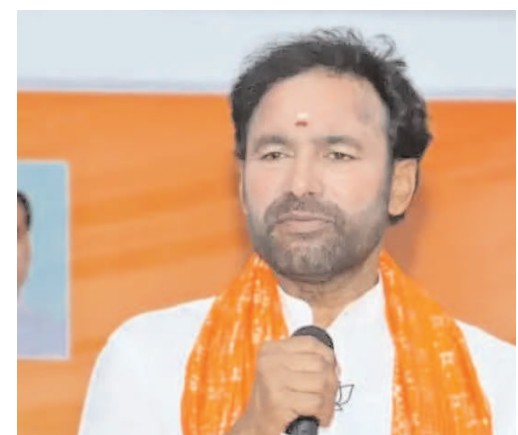
ఎలాంటి మార్పు రాలేదు.బి ఆర్ ఎస్ పార్టీ స్థానంలో కాంగ్రెస్ పార్టీ వచ్చింది. బిఆర్ఎస్ ఎమ్మెల్సీ డోపిడి చూశాం ఇప్పుడు కాంగ్రెస్ పార్టీ ఎమ్మెల్సీ డోపిడి చూస్తున్నాం.. కనీసం పార్టీ కి కానీ పదవికి రాజీనామా చేయకుండా ఎంపీ పోటీ చేసే దౌర్జన్యం పరిస్థితి తెలంగాణలో ఉందని ఎమ్మెల్సీ దానం నాగిందర్ ను ఉద్దేశిస్తూ అన్నారు.

హైదరాబాద్/ భువనగిరి: ఎమ్మెల్సీ ఎన్నికల్లో మూడు స్థానాలను బీజేపీ పార్టీ అభ్యర్థులు గెలుపొందిన కేంద్ర మంత్రి కిషన్ రెడ్డి అన్నారు. కాంగ్రెస్ పార్టీ ప్రభుత్వం పైన అన్నివర్గాల ప్రజల్లో తీవ్ర వ్యతిరేకత ఉంది. కాంగ్రెస్ ,బిఆర్ఎస్ పార్టీలకు ఎమ్మెల్సీ పోటీ చేస్తే ధైర్యం లేదు. అందుకే తెర వెనుక నాలుకాలు ఆడుతున్నారు. బి ఆర్ ఎస్ పార్టీ అధికారం ఉన్నప్పుడు మూడు డీపీ లను పెండింగ్ పెట్టింది...కాంగ్రెస్ ప్రభుత్వం రెండు డీపీలను పెండింగ్ పెట్టింది. ఉద్యోగ విరమణ చేసిన ఉద్యోగులకు ఇప్పాల్సిన బెనిఫిట్స్ రాష్ట్ర ప్రభుత్వం ఇచ్చే పరిస్థితి లేదు. కాంగ్రెస్ ఎన్నికల్లో నిరుద్యోగ భృతి ఇస్తా అని హామీ ని అమలు చేయడం లేదు. రాహుల్ గాంధీ రేవంత్ రెడ్డి డిమాండ్ చేస్తున్న సంవత్సరం పూర్తి రెండు లక్షల ఉద్యోగులు భర్తీ చేసే ఉంటే అసోక్ నగర్ లైబ్రరీ రావాలి. సకాలంలో ఫీజు రియంబర్స్ చేయకపోవడంతో పేద విద్యార్థులు భాగ పడుతున్నారు. పేద విద్యార్థులకు ఇస్తాను అన్న విద్య భరోసా కార్డు ఇప్పలేదు. బి.ఆర్.ఎస్ ప్రభుత్వం 317 జీవో తెచ్చి ఉద్యోగులను ఇబ్బంది పెట్టింది.రేవంత్ రెడ్డి సర్కార్ ఇచ్చిన ఏ ఒక హామీ కూడా అమలు చేయడం లేదు. మార్పు పేరుతో అధికారం లో వచ్చిన కాంగ్రెస్ ప్రభుత్వం..ప్రజలకు