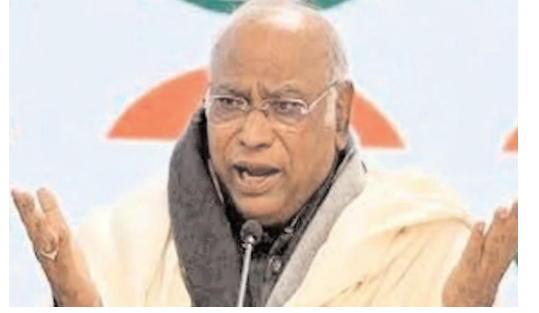
ఖర్గు చేసి (గంగా నదిలో) మునగడానికి పోటీ పడుతున్నారు. ఫోటోలో బాగా కనిపించే వరకు వారి స్నానాలు కొనసాగుతాయి' అని విమర్శించారు. కాగా, ఇలాంటి వ్యక్తులు దేశానికి

భోపాల్: ఉత్తరప్రదేశ్ లోని ప్రయాగ్ రాజ్ లో జరుగుతున్న మహాకుంభమేళా సందర్భంగా బీజేపీ నేతలు పవిత్ర స్నానాలు ఆచరించడంపై కాంగ్రెస్ అధ్యక్షుడు మల్లికార్జున్ ఖర్గే తీవ్రంగా విమర్శించారు. వారు గంగా నదిలో మునిగితే దేశంలో పేదరికం తొలగిపోతుందా? అకలితో ఉన్నవారి కడుపులు నిండుతాయా? అని ప్రశ్నించారు. సోమవారం మధ్యప్రదేశ్ లోని మోవేలో జరిగిన 'జై బాపు, జై భీమ్, జై సంవిధాన్' సభలో మల్లికార్జున్ ఖర్గే మాట్లాడారు. "నేను ఎవరి విశ్వాసాన్ని ప్రశ్నించాలనుకోవడం లేదు. ఎవరైనా తప్పుగా భావిస్తే నేను క్షమాపణలు కోరుతున్నా. అయితే నాకు చెప్పండి. ఒక పిల్లవాడు అకలితో చనిపోతున్నప్పుడు, స్కూల్ కు వెళ్లనప్పుడు, కార్మికులకు వారి బకాయిలు అందనప్పుడు, అటువంటి సమయంలో ఈ వ్యక్తులు (బీజేపీ నేతలు) వేల రూపాయలు