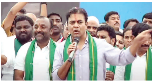
పోలీసులు దరఖాస్తు తీసుకోవడం లేదు. రేవంత్ రెడ్డి భయం పట్టుకుంది వాళ్లకు. అందుకే ఓట్లు వేస్తే రేవంత్ రెడ్డికి చురుకు పెట్టాలని కేటీఆర్ చెప్పారు.

100 శాతం రుణమాఫీ అయిందని రాసిస్తే.. బీఆర్ఎస్ ఎమ్మెల్యేలం రాజీనామా చేస్తాం. రాష్ట్రంలో ఏ ఒక్క ఊరిలోనైనా వంద శాతం రుణమాఫీ అయిందని రాసిస్తే.. బీఆర్ఎస్ ఎమ్మెల్యేలమంతా రాజీనామా చేస్తామని సీఎం రేవంత్ రెడ్డికి బీఆర్ఎస్ వర్కింగ్ ప్రెసిడెంట్ కేటీఆర్ సవాల్ విసిరారు. రంగారెడ్డి జిల్లా షాబాద్ లో ఏర్పాటు చేసిన రైతు సభలో కేటీఆర్ పాల్గొని ప్రసంగించారు. ఇవాళ పేపర్లలో టైప్ చేశారా చూసినా.. రేవంత్ రెడ్డి ఢిల్లీకి పోయింది.. అక్కడ స్టేట్ ఇన్స్టిట్యూట్.. తెలంగాణలో మొత్తం ఉద్ధరించిన.. ఢిల్లీలో కూడా ఉద్ధరిస్తానని, మీరు నా మాట నమ్మి కాంగ్రెస్ పార్టీకి అధికారం ఇవ్వండి. తెలంగాణలో ఆరు గ్యారెంటీలు అమలు చేశాం.. రుణమాఫీ చేశాం. 100 రోజుల్లో ఇచ్చిన మాట నిలబెట్టుకున్నా.. ఢిల్లీలో కూడా అదే చేస్తానని రేవంత్ రెడ్డి చెబుతున్నాడు. అమ్మకు అన్నం పెట్టనోడు చిన్నమ్మకు బంగారు గాజులు చేయిస్తాడా..? కూట్లో రాయి తీయనోడు.. ఏట్లో రాయి తీస్తాడా..? సీఎం అబద్ధాలు చెప్పావా..? ఆరు గ్యారెంటీలలో ఆరు గ్యారెంటీ అమలైంది.. అది కూడా డ్రీ బస్సు మా ఊరికి బస్సు దిక్కు లేదు అని కొందరు లాల్చి పెడుతున్నారు. మీరు తిట్టే తిట్లకు రోషమున్నాడు అయితే బెత్తకో నీళ్లు నింపుకుని దాంట్లో దూకి చచ్చిపోతాడు. కానీ ఆయన రేవంత్ రెడ్డి.. ఆయనకు రోషం, సిగ్గు లేదు. అబద్ధాలు చెప్పేడు ఆయనకు అలవాటు. ఒక్క