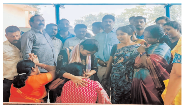
ప్రమాదానికి కారకులైన అధికారుల పై చర్యలు తీసుకోవాలి. గుర్తింపు సంఘం ఏజెంట్లను ఉప ప్రధాన కార్యదర్శి వై.వి.రావు డిమాండ్.