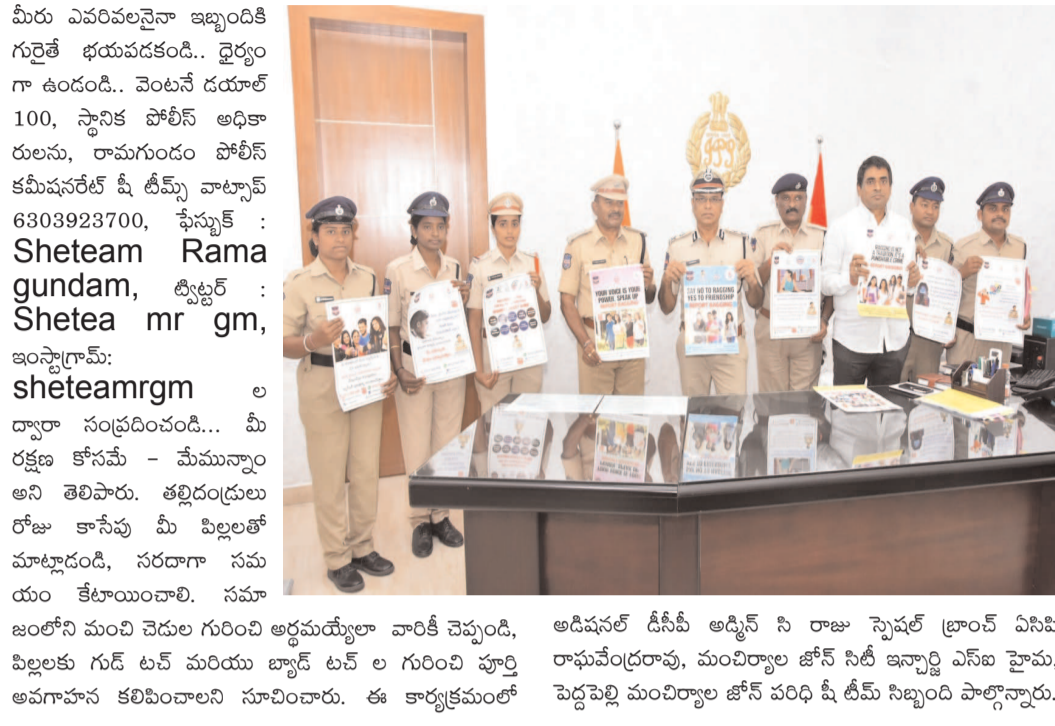
మీరు ఎవరవలనైనా ఇబ్బందికి గురైతే భయపడకండి.. ధైర్యంగా ఉండండి.. వెంటనే దయాల్ 100, స్థానిక పోలీస్ అధికారులను, రామగుండం పోలీస్ కమీషనరేట్ షీ టీమ్ వాట్సాప్ 6303923700, ఫేస్ బుక్ : Sheteam Rama gundam, ట్విట్టర్ : Shetea mr gm, ఇంస్టాగ్రామ్: sheteamrgm ల ద్వారా సంప్రదించండి... మీ రక్షణ కోసమే - మేమున్నాం అని తెలిపారు. తల్లిదండ్రులు రోజూ కాసేపు మీ పిల్లలతో మాట్లాడండి, సరదాగా సమయం కేటాయించాలి. సమాజంలోని మంచి చెడుల గురించి అర్థమయ్యేలా వారికి చెప్పండి, పిల్లలకు గుడ్ టవ్ మరియు బ్యాడ్ టవ్ ల గురించి పూర్తి అవగాహన కలిపించాలని సూచించారు. ఈ కార్యక్రమంలో