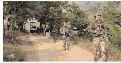
రైతులపై మిలిటెంట్ల కాల్పులు..

ఇంఫాల్: మణిపూర్ లో కుకీ మిలిటెంట్ల తెగబడ్డారు. జిరిబామ్ జిల్లాలోని సెంట్రల్ రిజర్వ్ ఫోలిన్ ఫోర్స్ సోమవారంనాడు దాడికి పాల్పడ్డారు. వెంటనే అప్రమత్తమైన సీఆర్పీఎఫ్, అసోం రెఫోర్స్ బలగాలు ఎదురుకాల్పులకు దిగడంతో ఎన్కౌంటర్ చోటుచేసుకుంది. ఈ ఎన్కౌంటర్లో 11 మంది కుకీ మిలిటెంట్లు హతమయ్యారు. ఒక సీఆర్పీఎఫ్ జవాను గాయపడటంతో హాటాహూడిని ఆసుపత్రికి తరలించారు. మణిపూర్ లో ఇంఫాల్ వ్యాపికి చెందిన మొయతీలు, కొండ ప్రాంతాల్లో నివసించే కుకీల మధ్య గత ఏడాది మే నుంచి జరుగుతున్న జాతుల ఘర్షణ, హింసాకాండలో 200 మందికి పైగా ప్రాణాలు కోల్పోగా, వేలాది మంది నిరాశ్రయులయ్యారు.