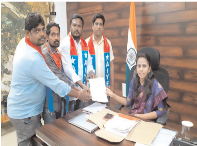
జామ్ కావడంతోపాటు సాయి లీల ఎదురుగా హోండా షోరూం పక్కన కాలువ నీరుజమై పూర్తిగా బురదమయంగా మారిపోయిందని తెలిపారు. నూతన మున్సిపల్ చట్టం ప్రకారం నాలాపై నిర్మాణం కానీ నాలాను కట్టడం గానీ చేసిన వారిపై