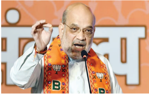
స్వామీలు వారికి పరిపాటి..