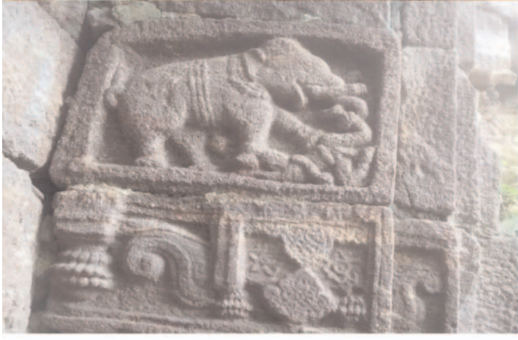
మరియు 25 మీటర్ల పొడవు గల అతి పెద్ద ఫిరంగి, నాల్గవ దర్వాజా పై గల సృష్టిశిల్పాలతో